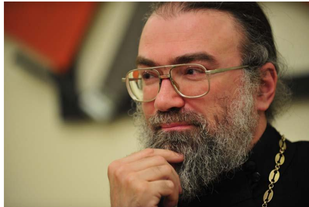
Игумен Петр (Мещеринов)