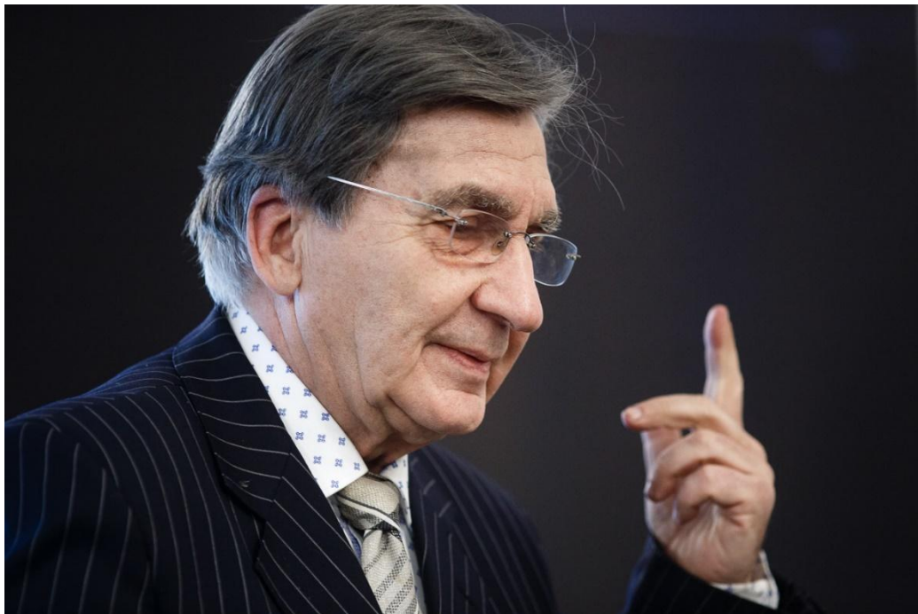
Проф. М. А. Сапонов