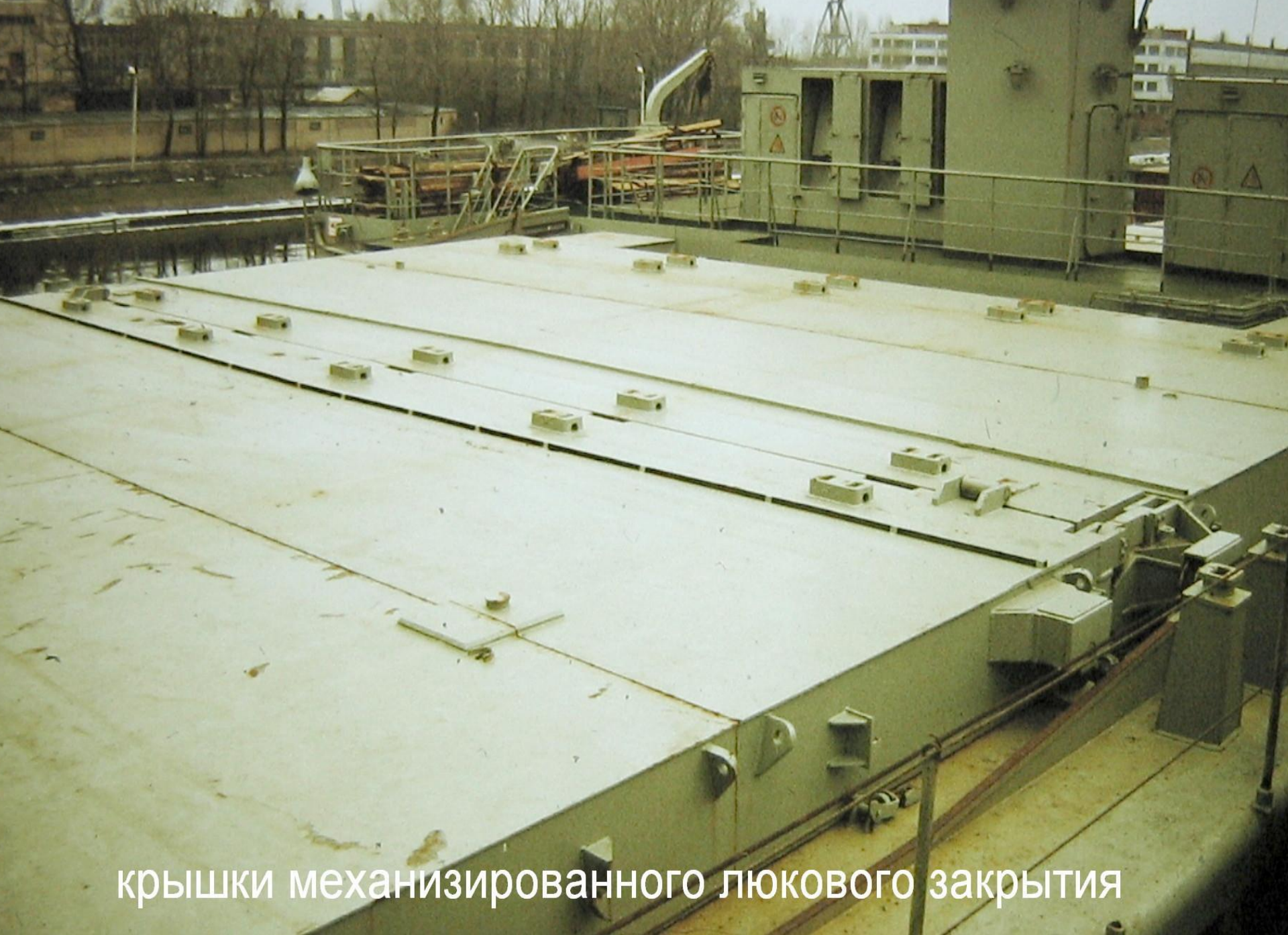
крышки механизированного люкового закрытия