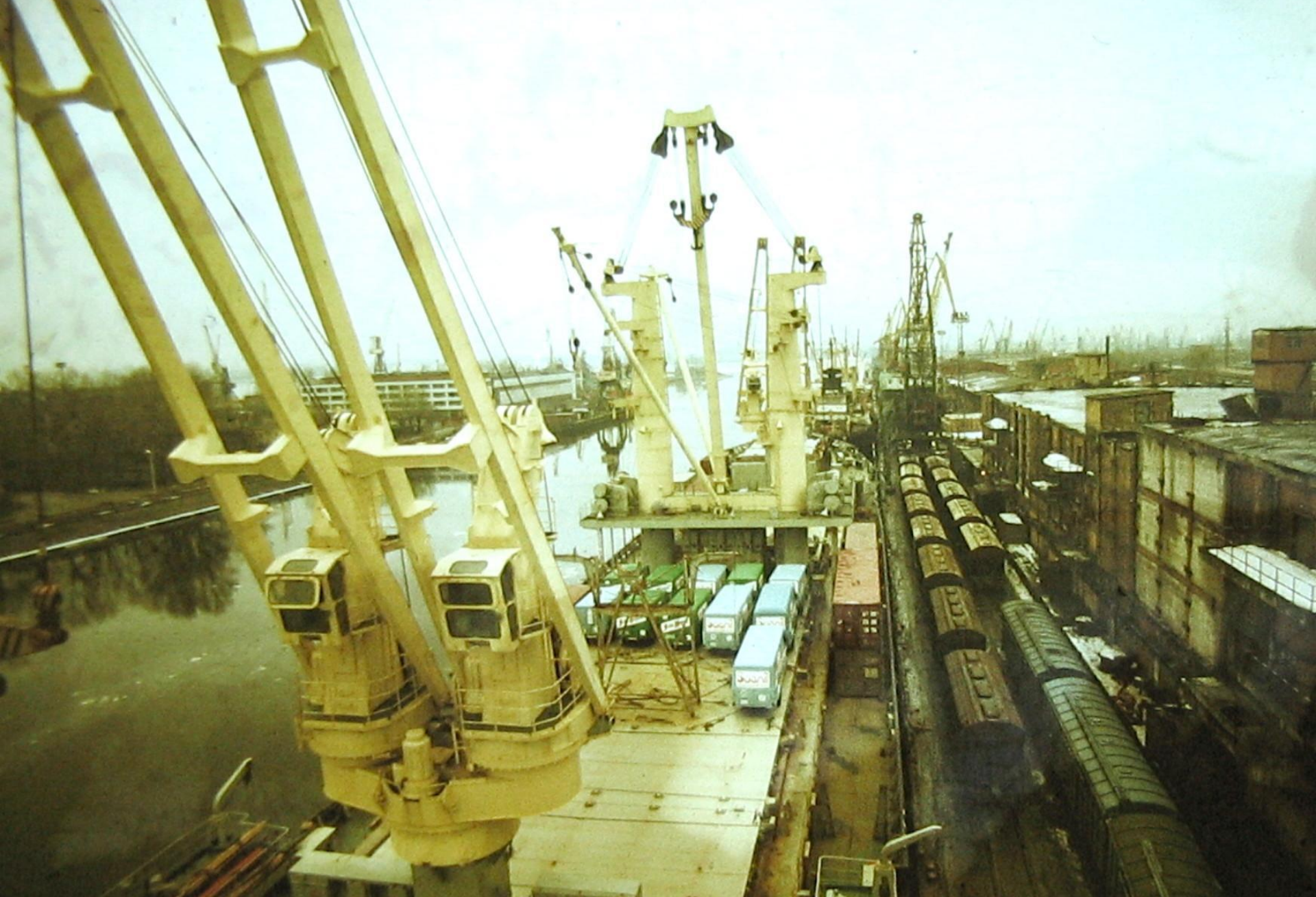
спаренные грузовые краны и тяжеловесные механизированные грузовые стрелы