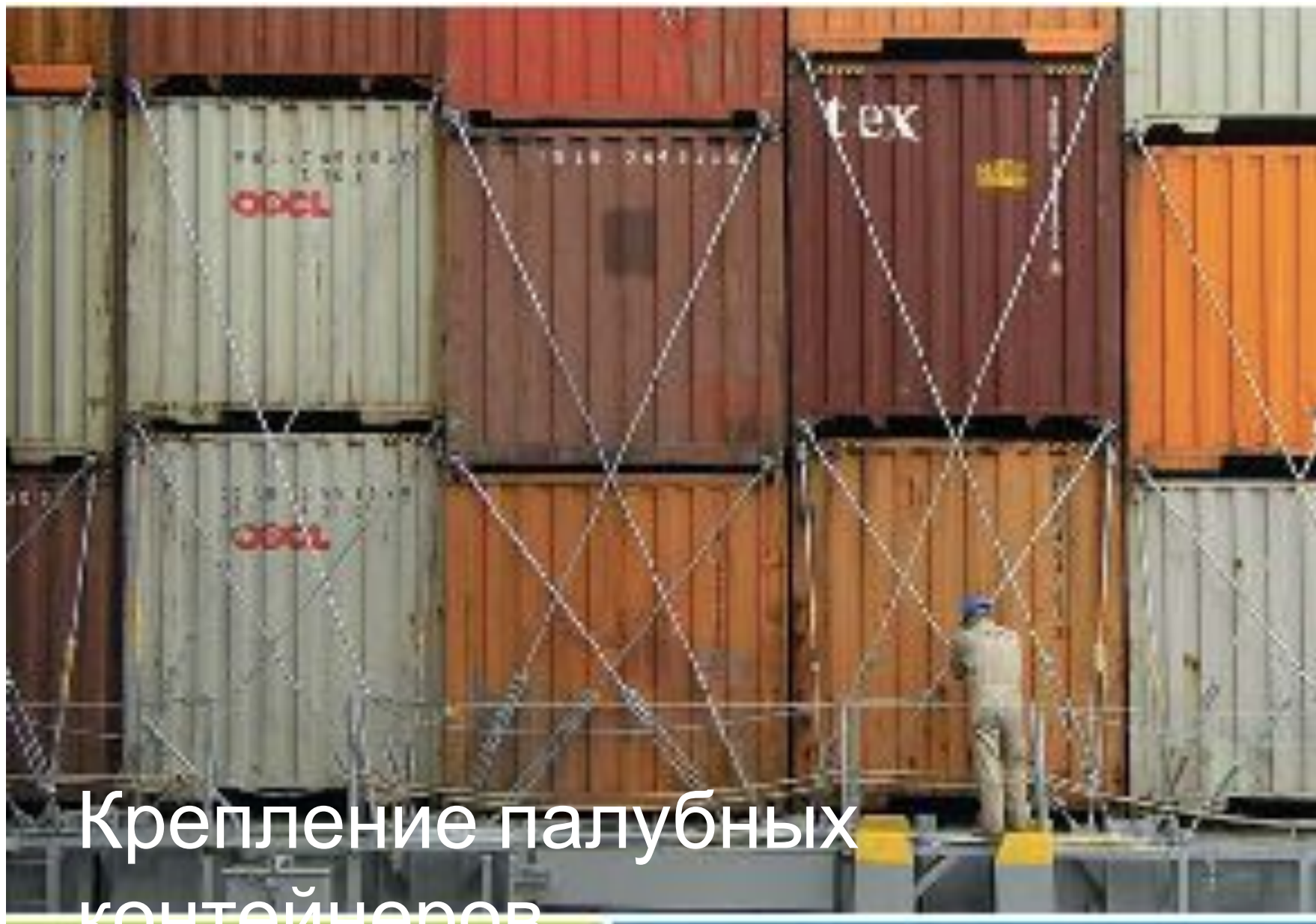
Крепление палубных контейнеров