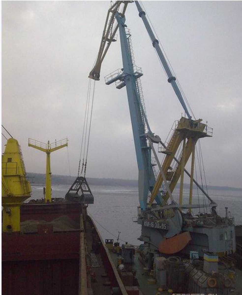
Грейферный захват для перегрузки массовых грузов