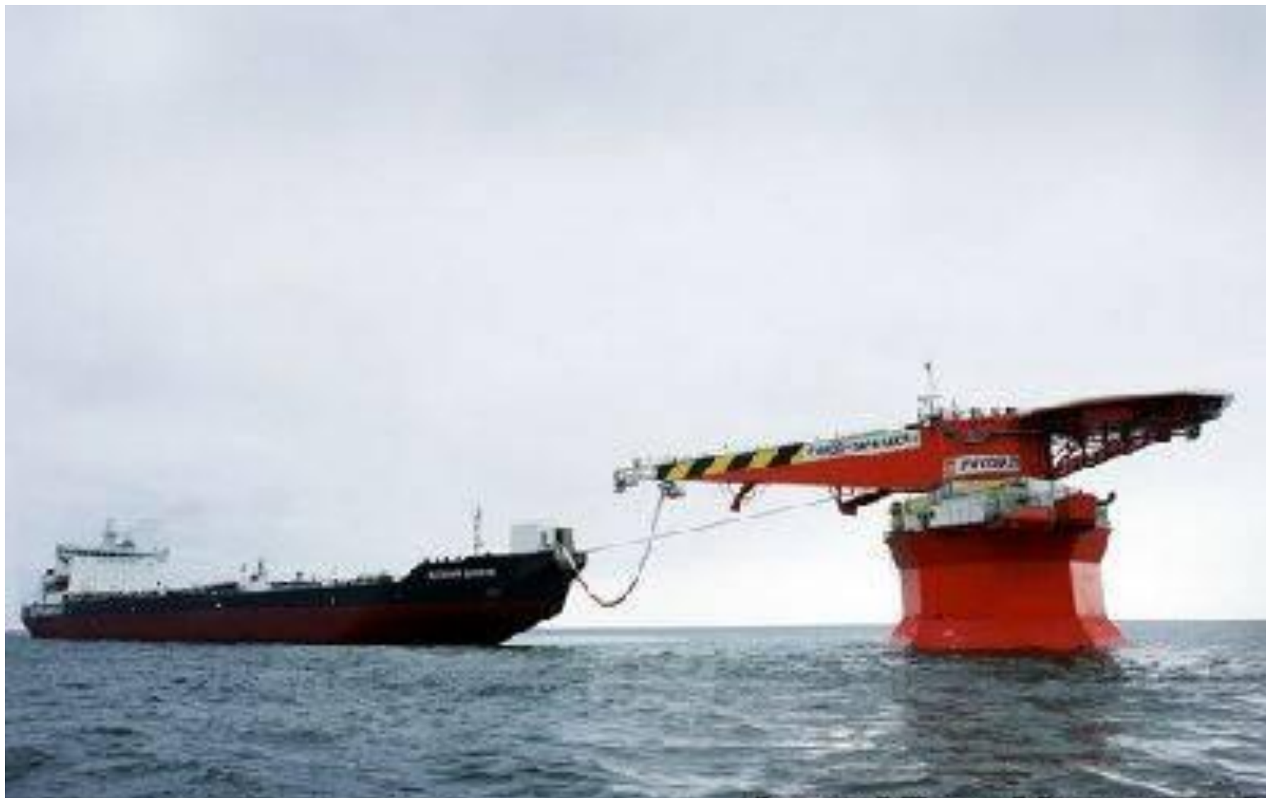
Грузообработка танкера у точечного причала