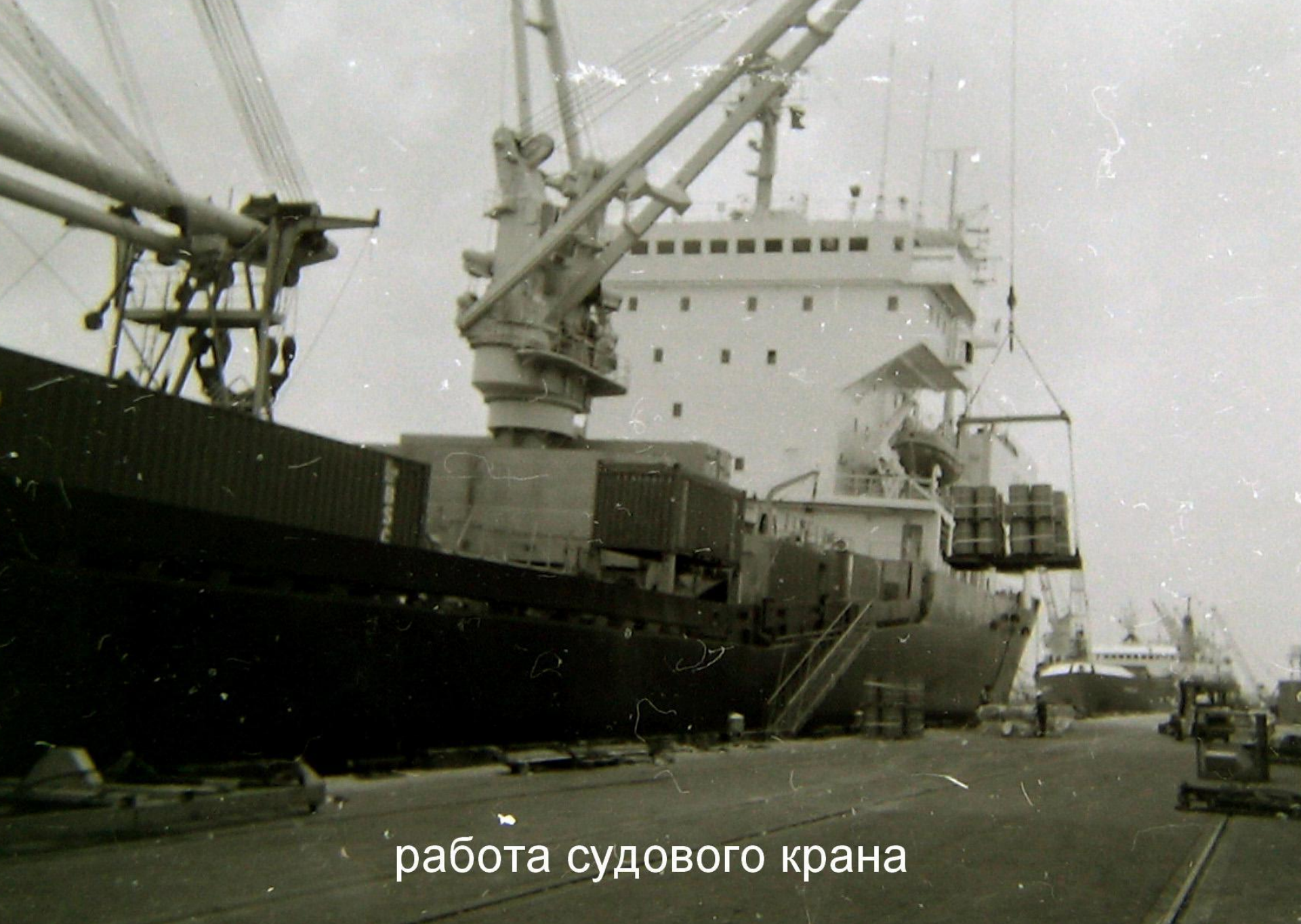
работа судового крана