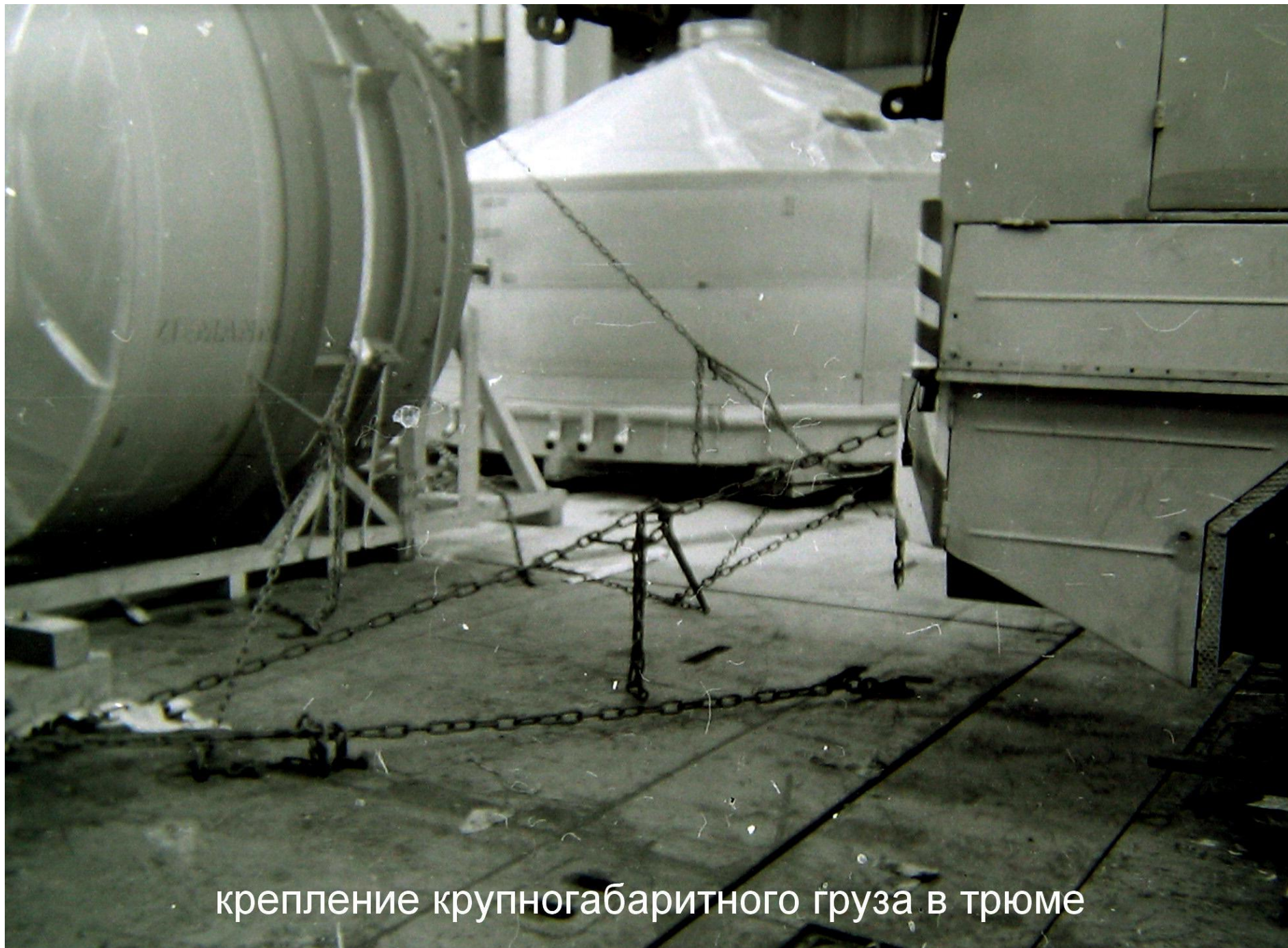
крепление крупногабаритного груза в трюме