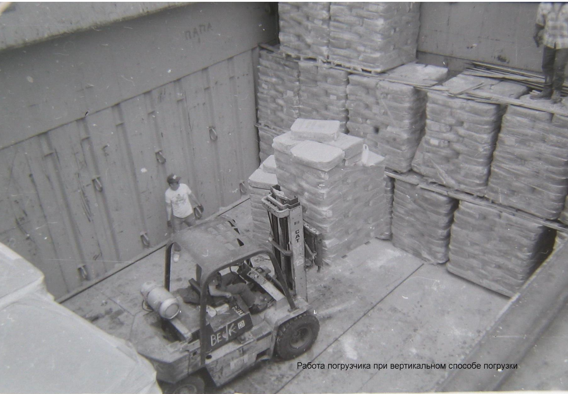
Работа погрузчика при вертикальном способе погрузки