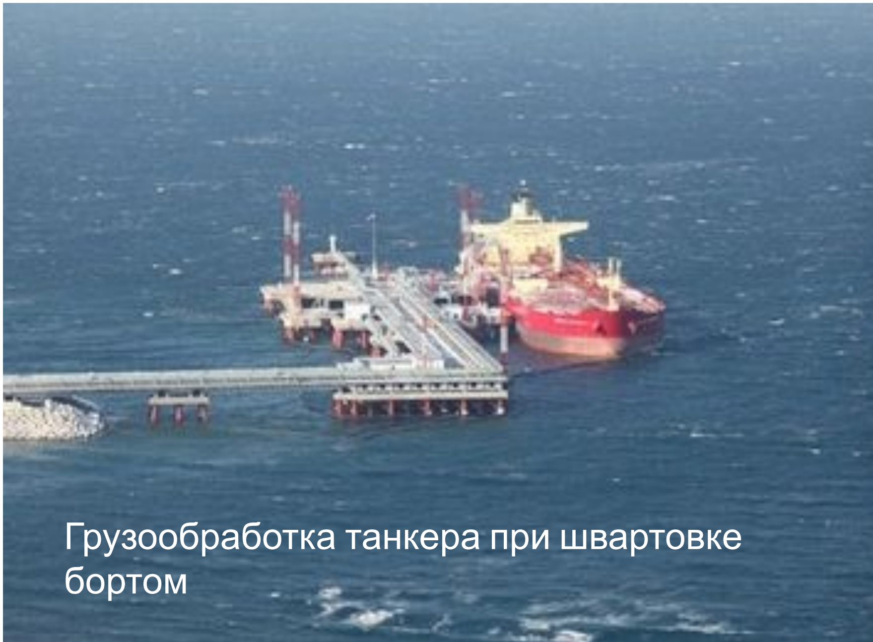
Грузообработка танкера при швартовке бортом