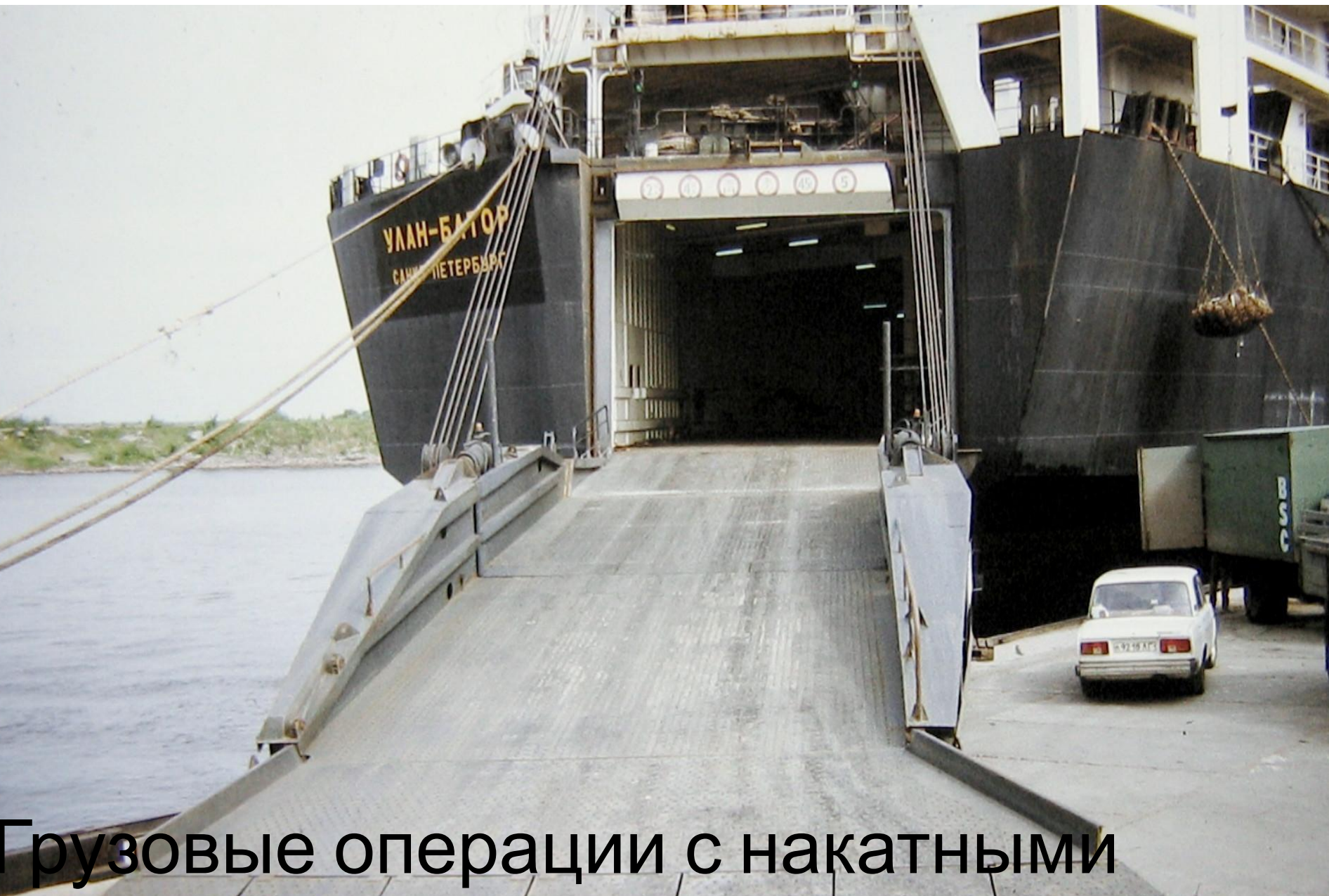
Грузовые операции с накатными