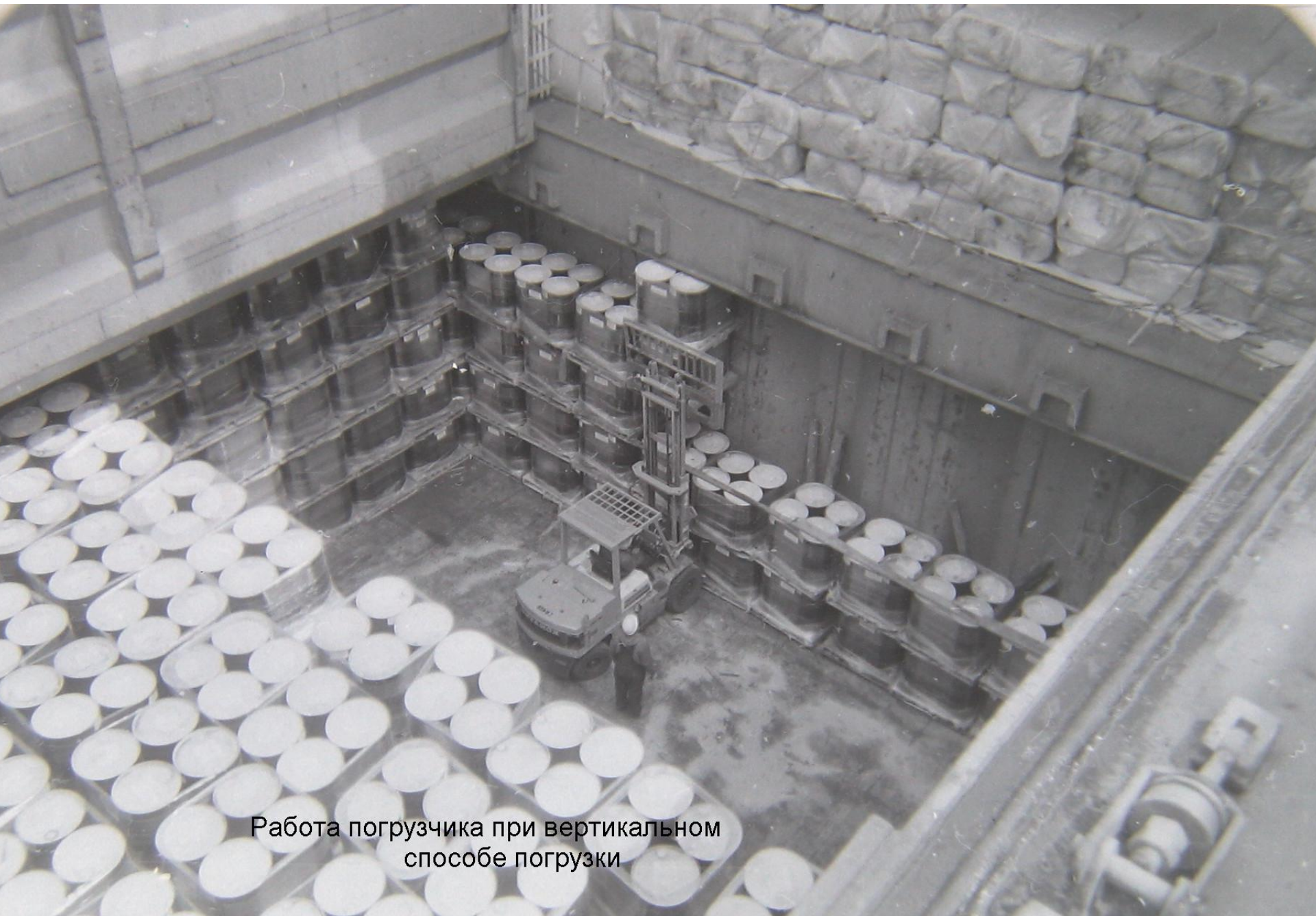
Работа погрузчика при вертикальном способе погрузки