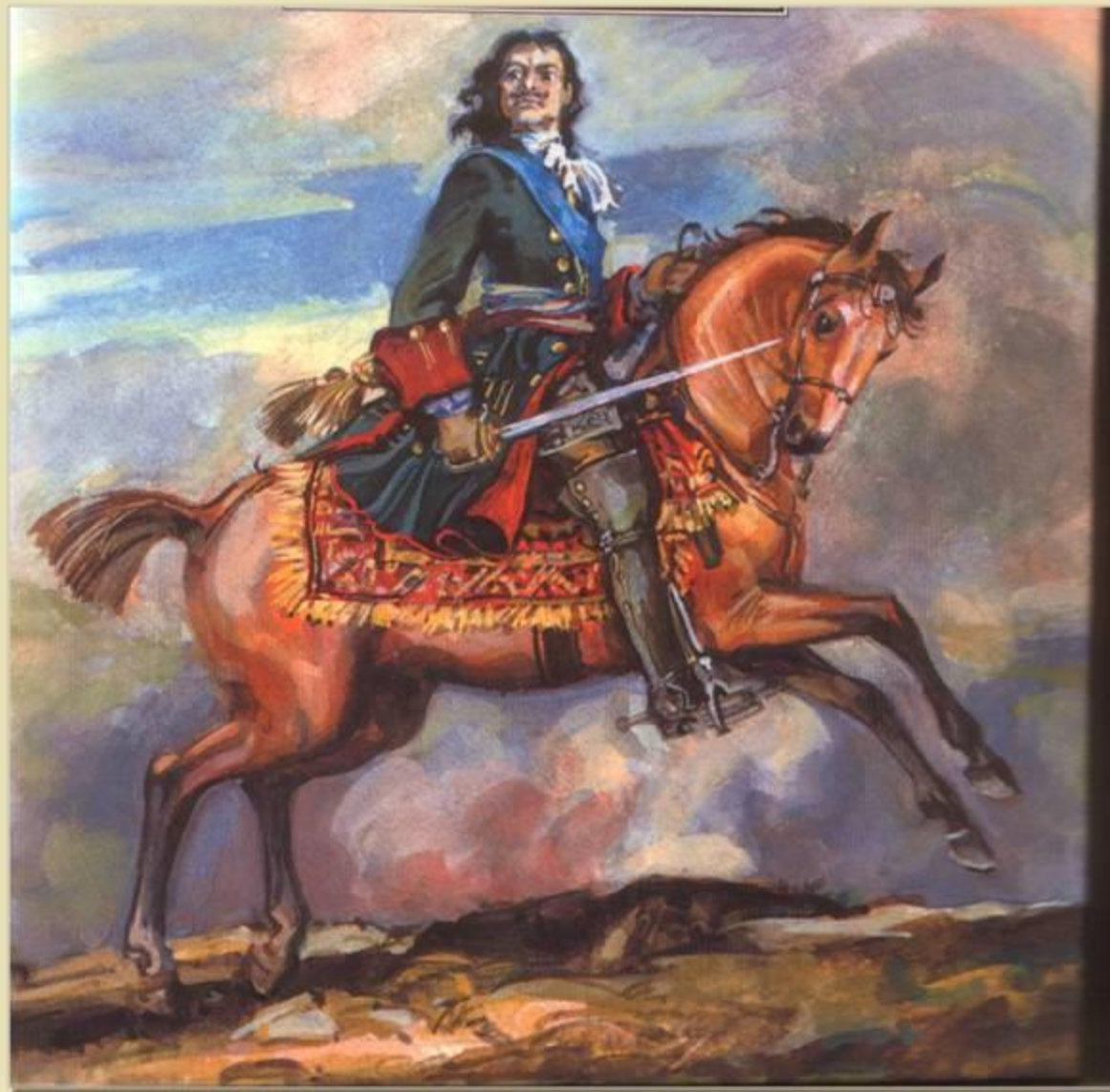
Иллюстрация к поэме А. С. Пушкина «Полтава». Художник Ю. Иванов