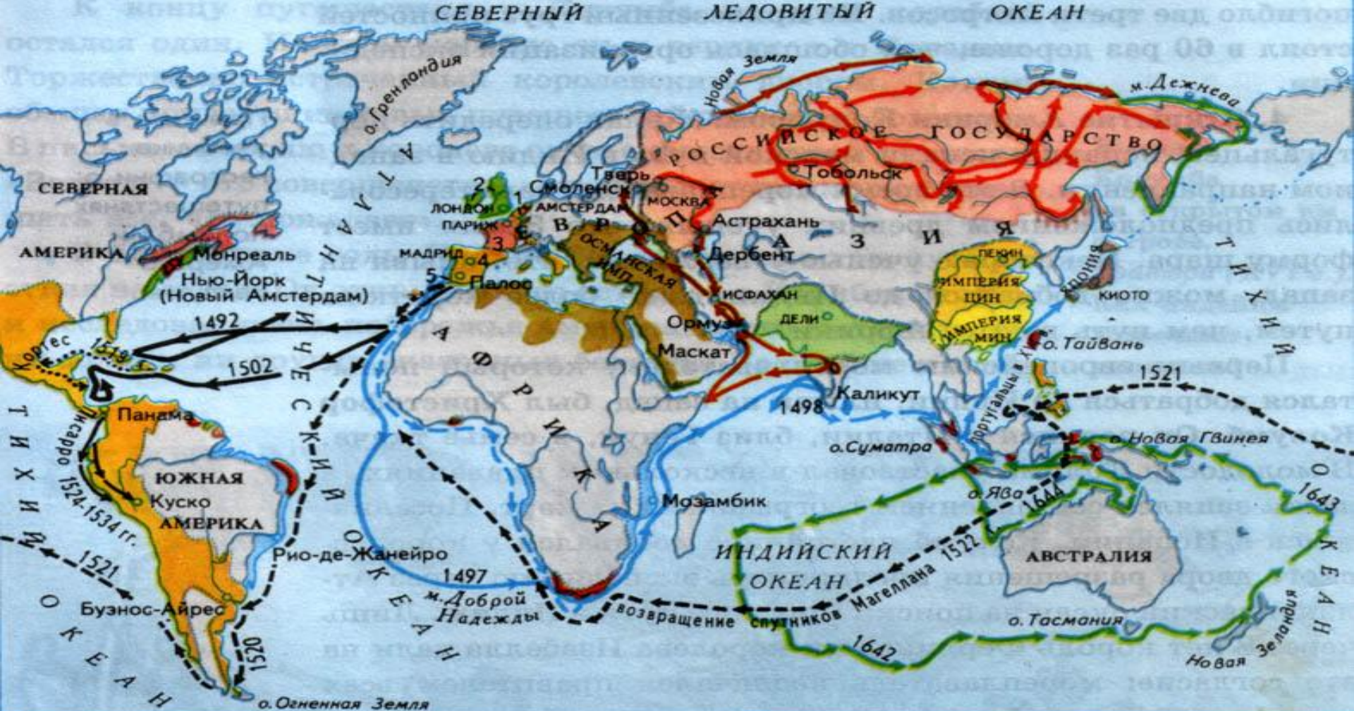
Маршруты важнейших путешествий в XV-середине XVII в.