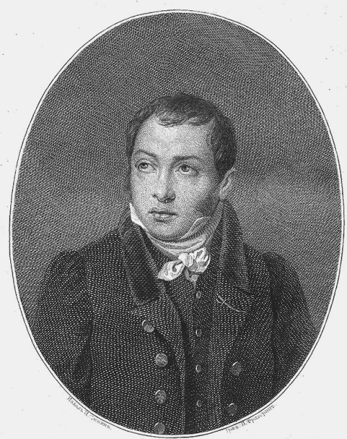
Фаддей Венедиктович Булгарин

Представители: Ф.В. Булгарин, Н.И. Греч, М.П. Погодин, С.П. Шевырев, О.И. Сенковский.