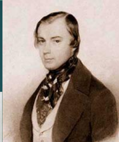
Осип Иванович Сенковский