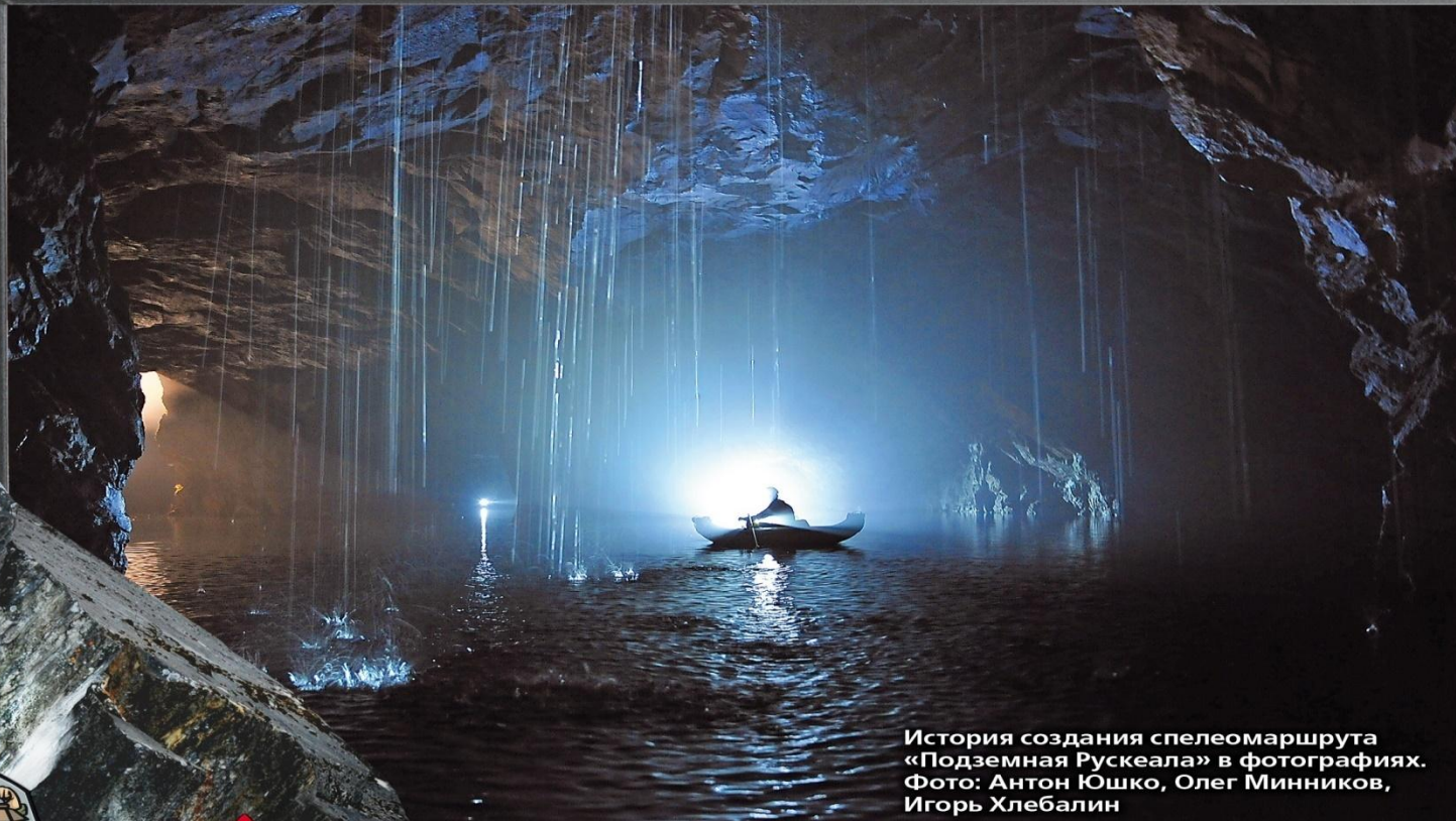
История создания спелеомаршрута «Подземная Рускеала» в фотографиях.