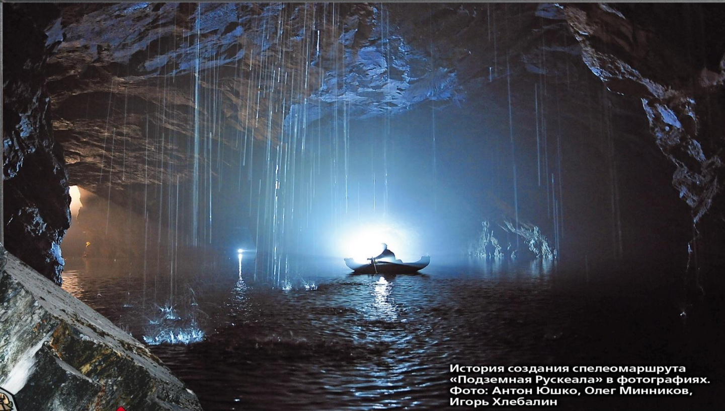
История создания спелеомаршрута «Подземная Рускеала» в фотографиях.