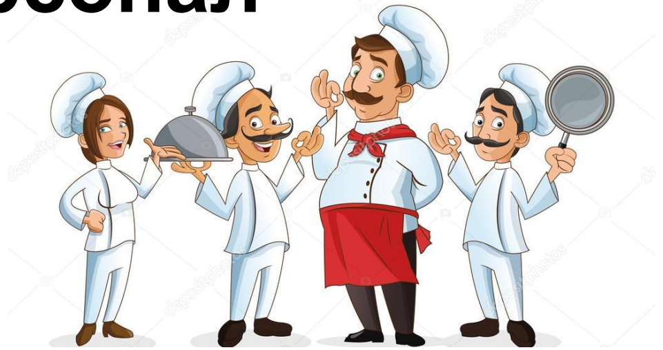
Шеф-повар и 3 повара