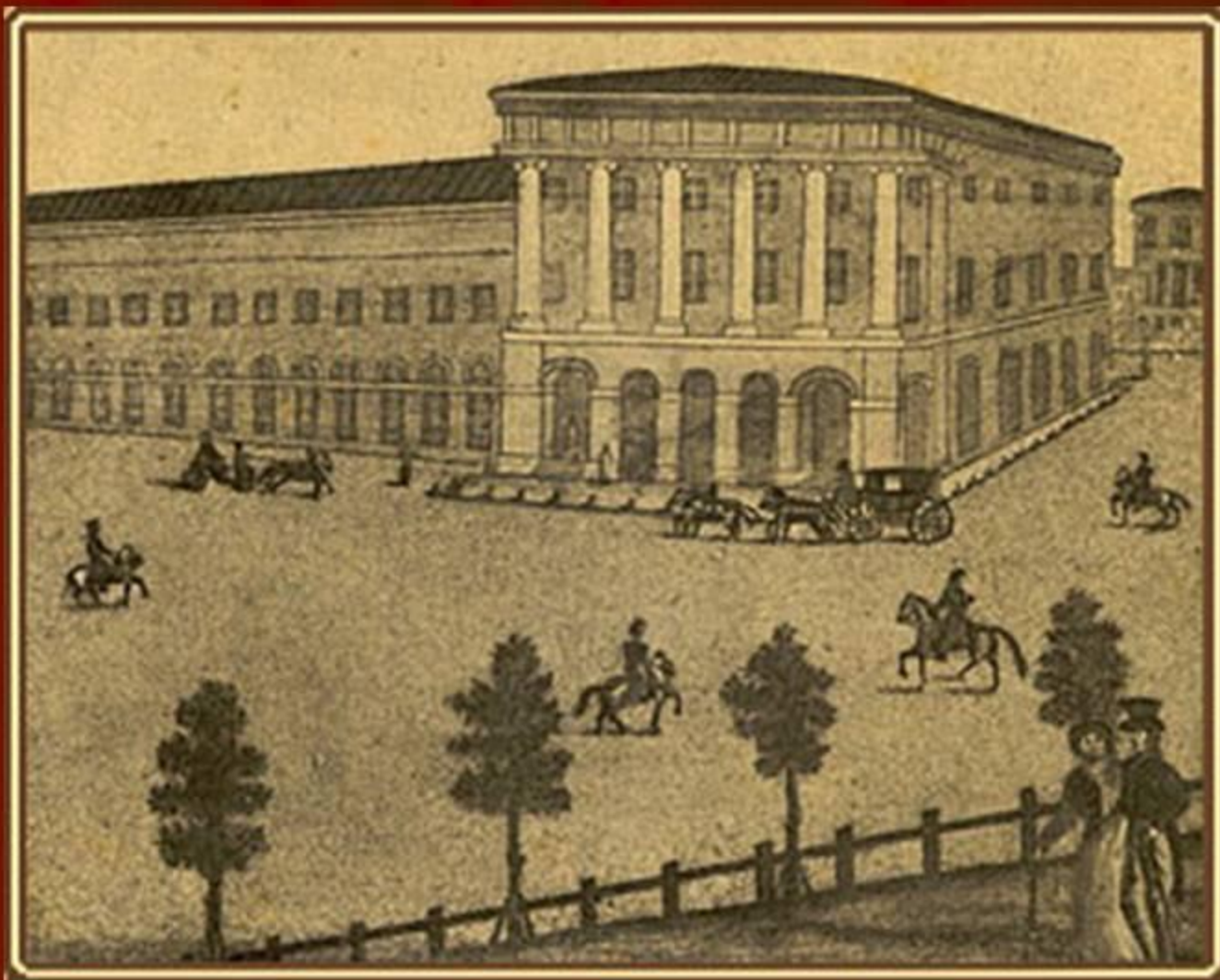
Государственный Академический Малый Художественный театр