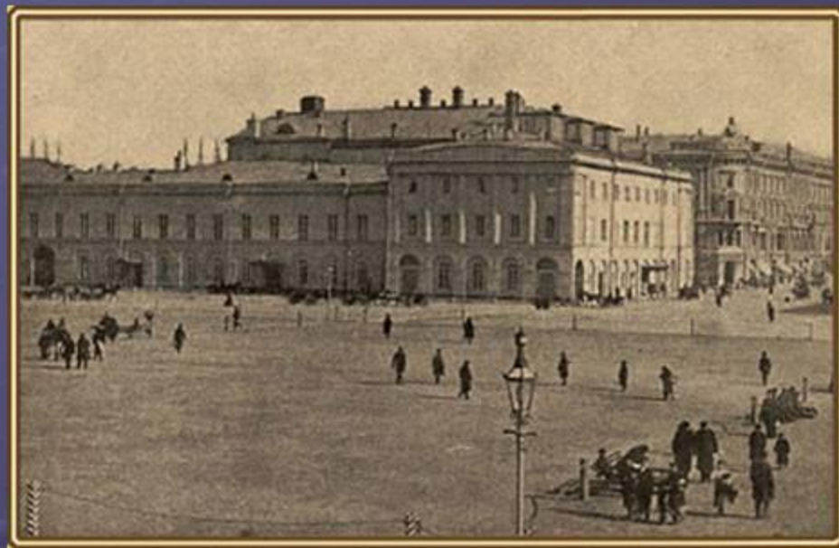
Здание Московского Малого театра, фотография 90-х годов XIX века