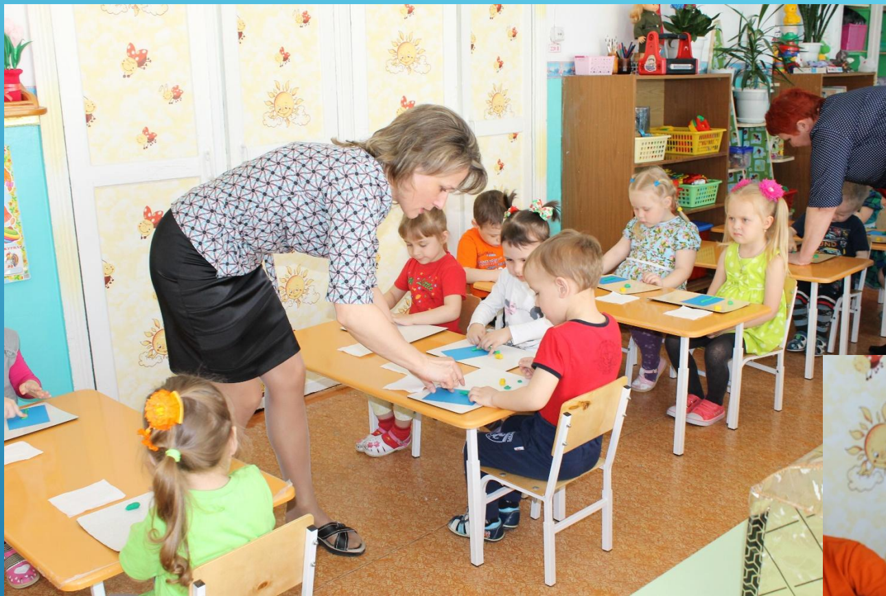
Изготовление одуванчика со стебелька