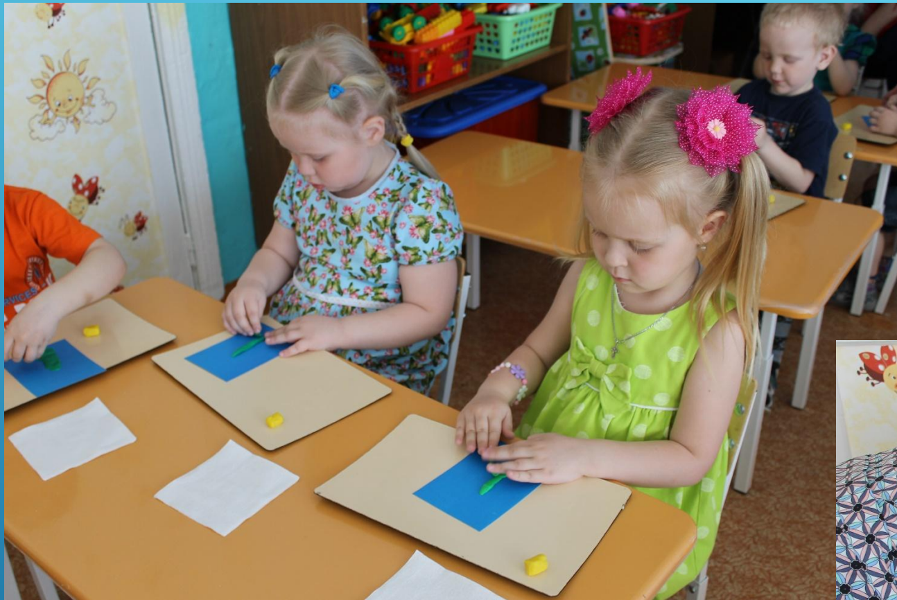
Листочек для цветка