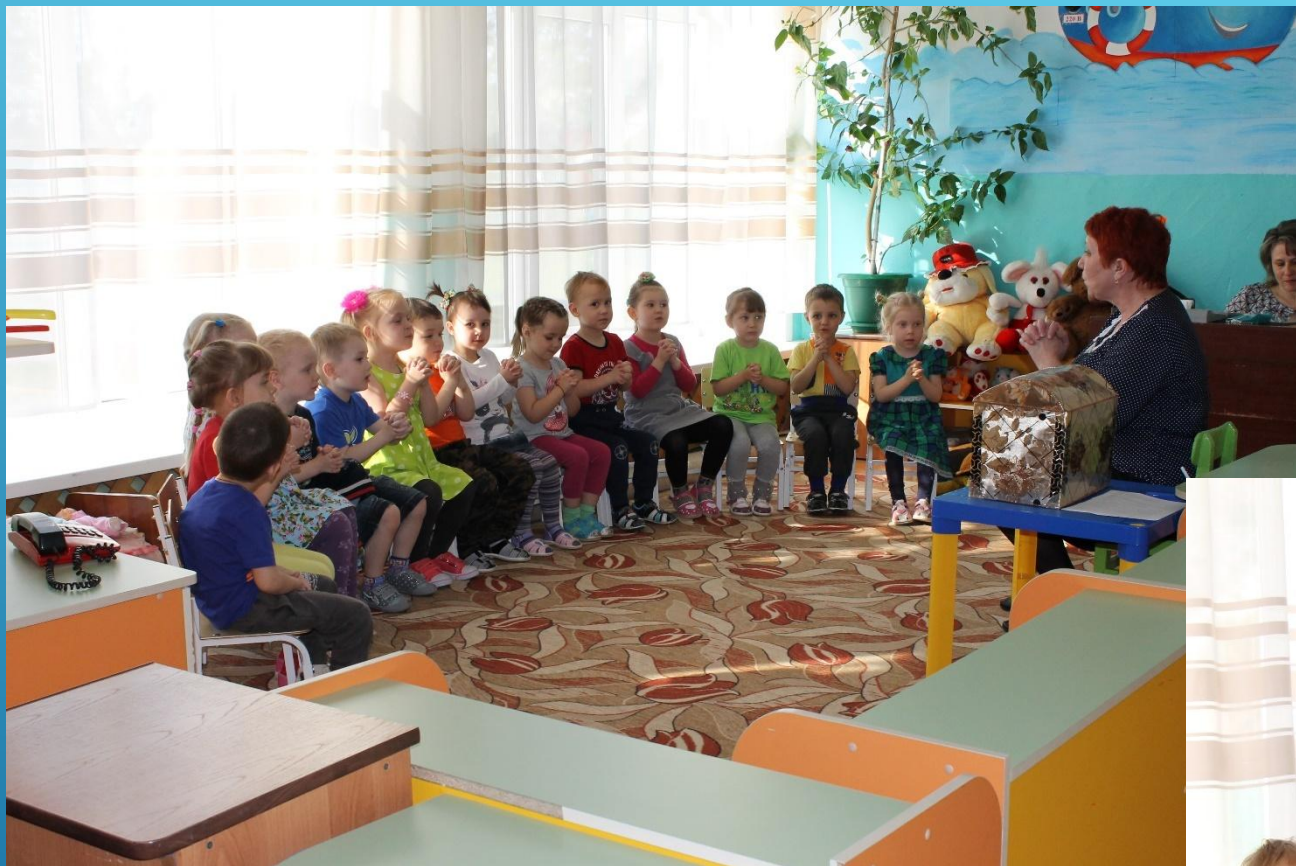
Открываем сундучок (пальчиковая гимнастика)