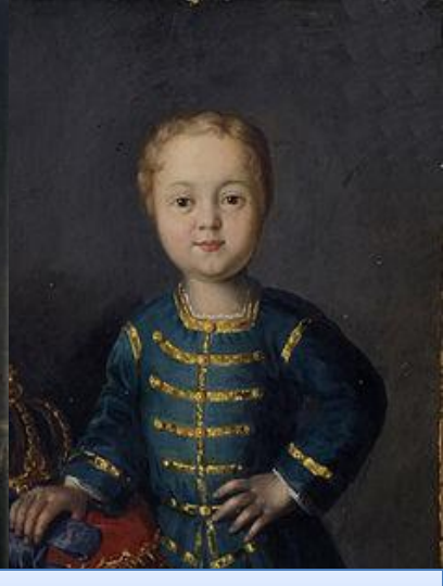
Иоанн VI 1740-1741