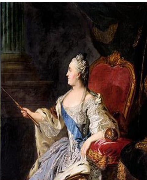
Екатерина II 1762-1796