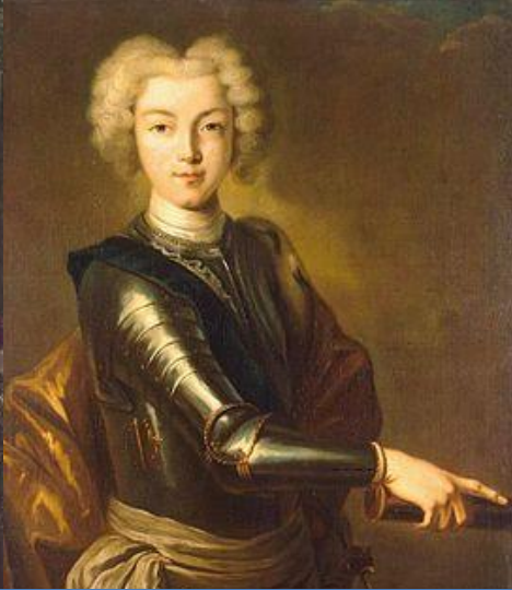
Петр II 1727 - 1730