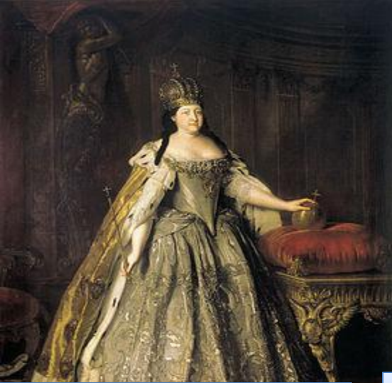
Анна Иоановна 1730-1740