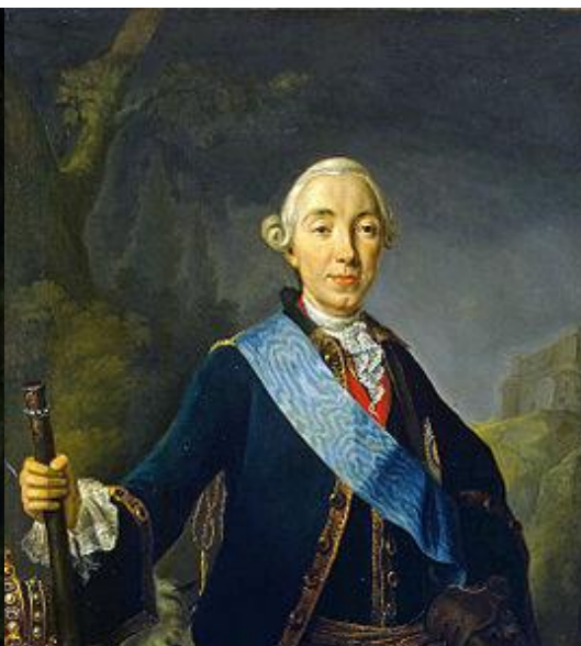
Петр III 1762