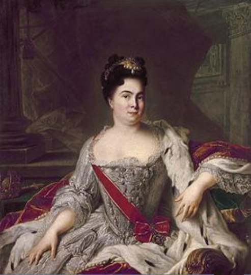
Екатерина I 1725-1727