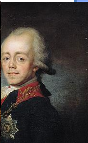
Павел I 1796 - 1801