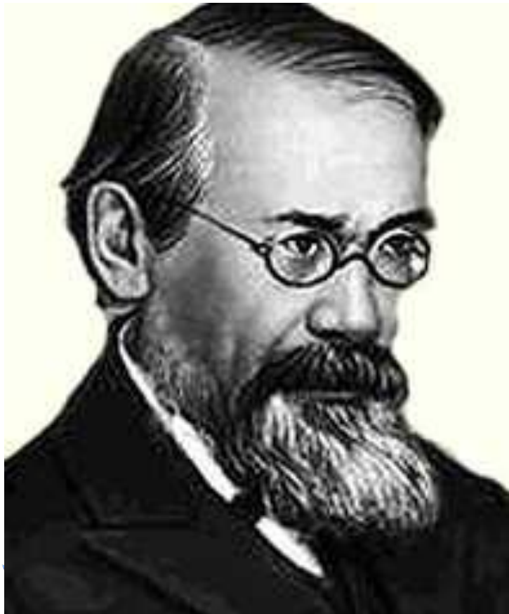
Ключевский Василий Осипович 1841-1911

Характеристика периода с 1725 по 1762 г. как эпохи дворцовых переворотов была введена в науку В.О. Ключевским.