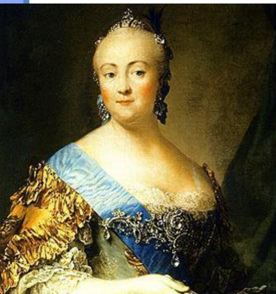
Елизавета Петровна 1741-1762