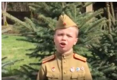
Мы помним, мы гордимся!