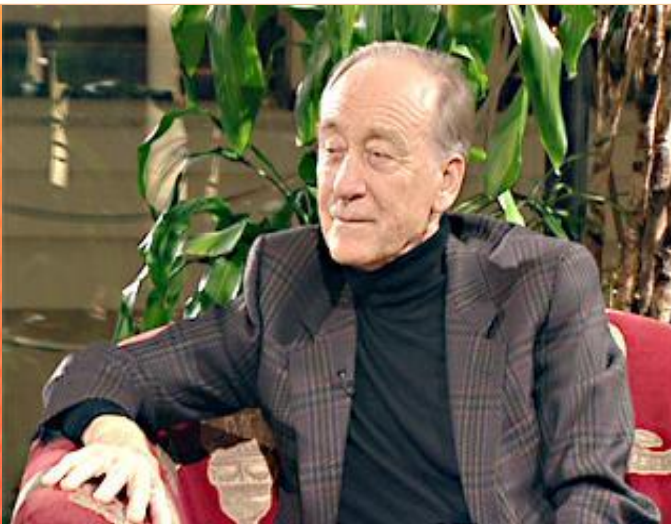
Родион Константинович Щедрин (р. 1932)