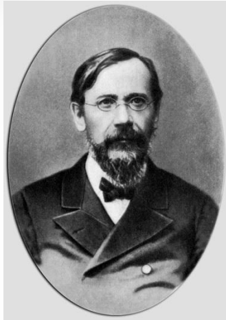
Василий Осипович Ключевский