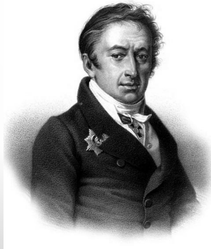
Николай Михайлович Карамзин