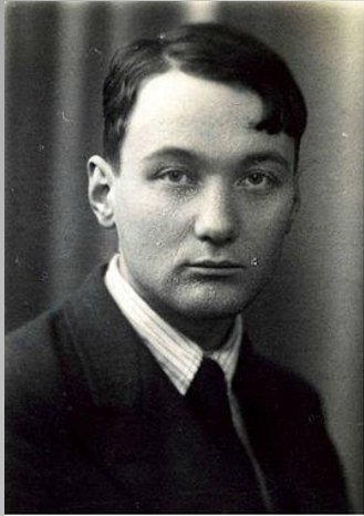
Лев Николаевич Гумилев