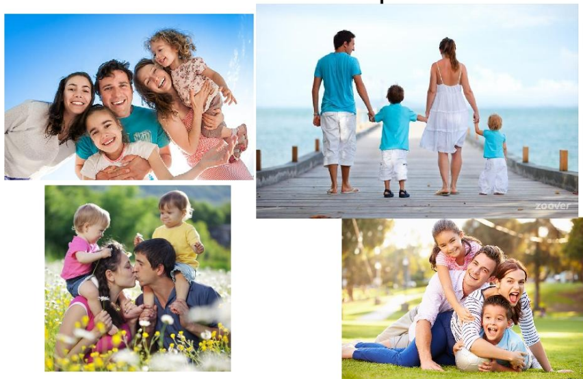
Коллаж «Семейные ценности»