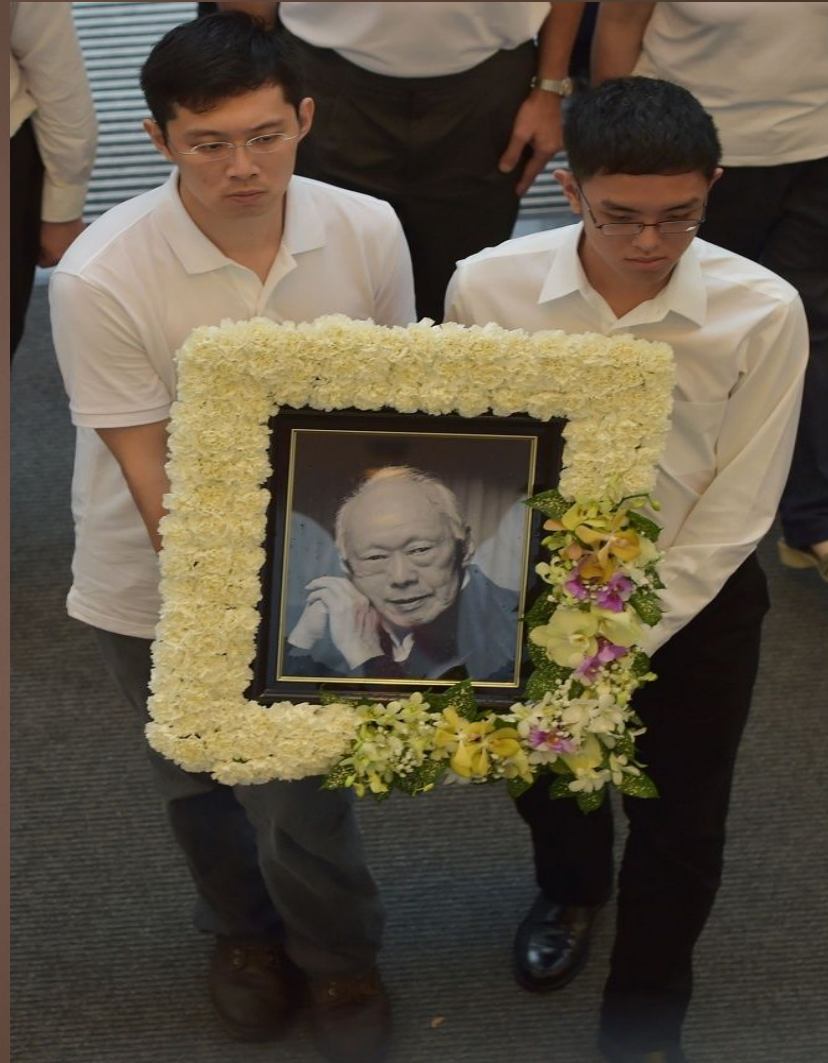
3 Лі прощались тиждень

Прощання з Лі, який займав цю посаду протягом 31 року, тривало майже тиждень, а бажаючі віддати данину поваги покійному стояли в черзі по 8 (!) годин. Багато хто не могли стримати сліз. І це не дивно: 91-річний колишній правитель зробив з найбіднішого острова в світі одну з найбагатших країн.