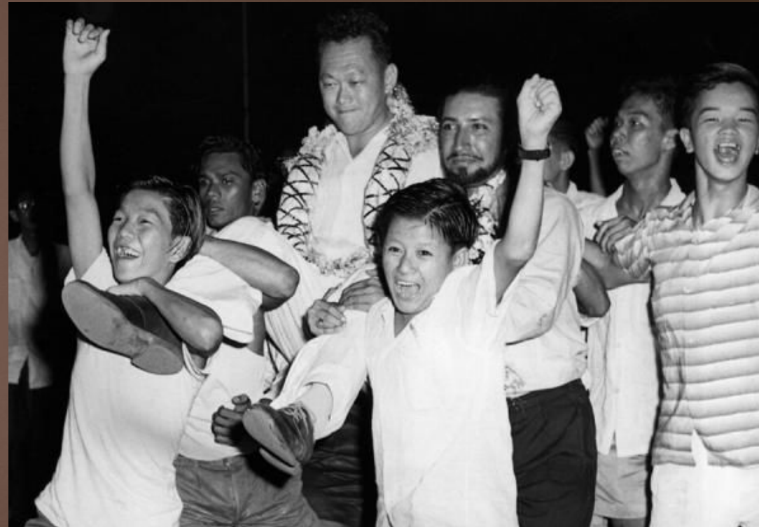
1959 рік. Сінгапурці були впевнені, що вибрали надійну людину.

Відразу після здобуття незалежності Лі заявив, що нова країна буде будуватися на основі ідей мультикультуралізму – тут будуть поважати всі релігії, а всі національності отримають рівні права. Ця ідея була потрібна Сінгапуру як повітря, адже тут змішалися багато національностей і релігій: 76,8% китайців, 13,9% малайців, 7,9% індійців, а також англійці, араби, євреї та багато інших. 40% населення сповідує буддизм, інші є християнами, мусульманами та представниками інших релігій. Національною ідеєю нової країни стали не красиві патріотичні гасла, а раціональний прагматизм, заснований на загальному бажанні жити в достатку, за законом і справедливостю.