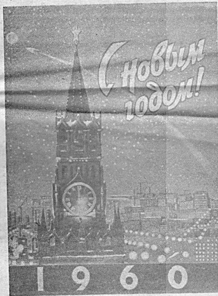
Фотомонтаж художника А. Перельмана.