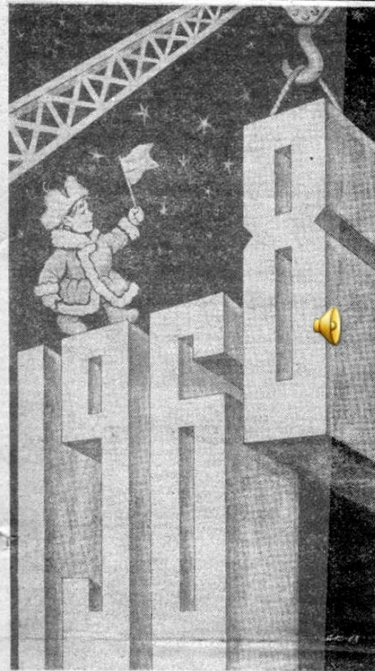
Рисунок художника Ал. Кручины.