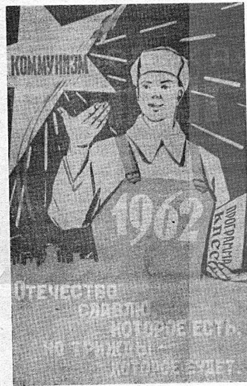
Плакат художника Б. Антонова.