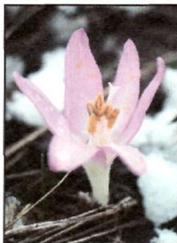
Брандушка русская разноцветная