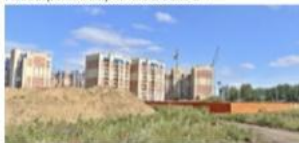
Парк Семейного отдыха