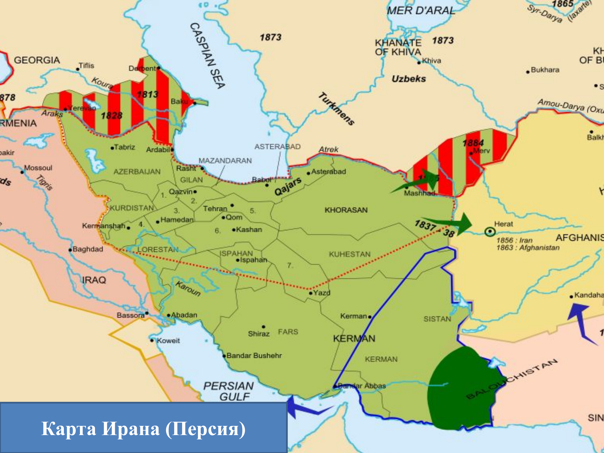
Карта Ирана (Персия)