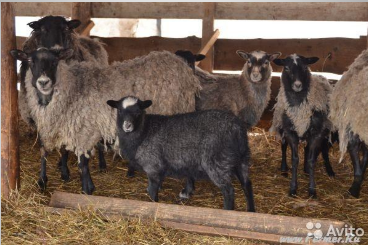
Калмыцкая порода овец на всероссийской ВЫСТАВКЕ