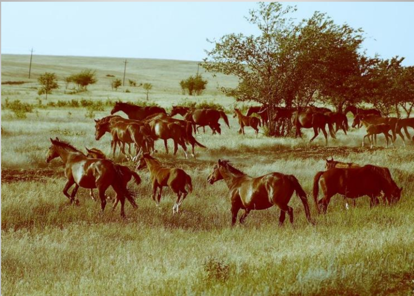
Лошади в степи