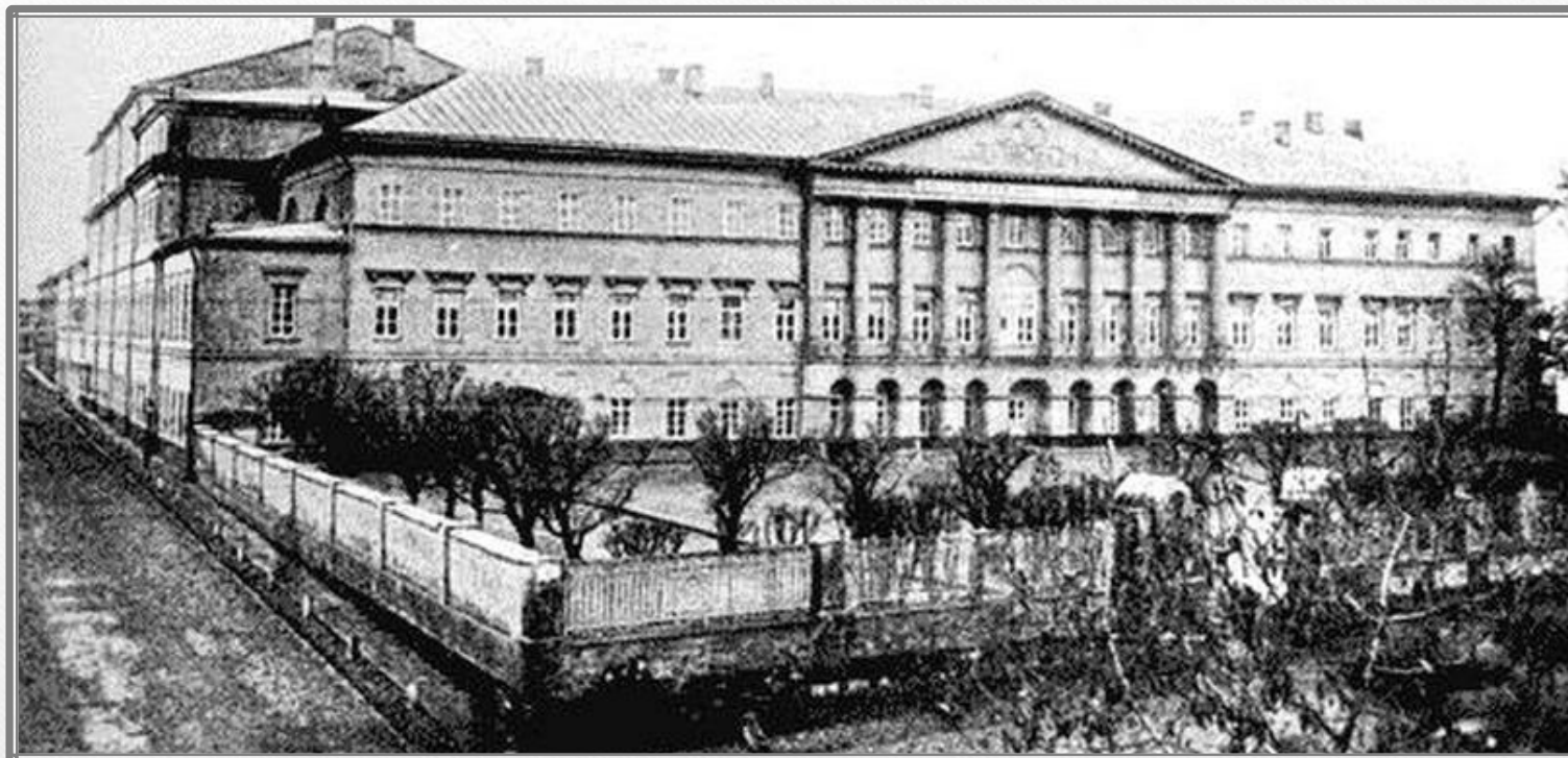
Коммерческое училище в Москве