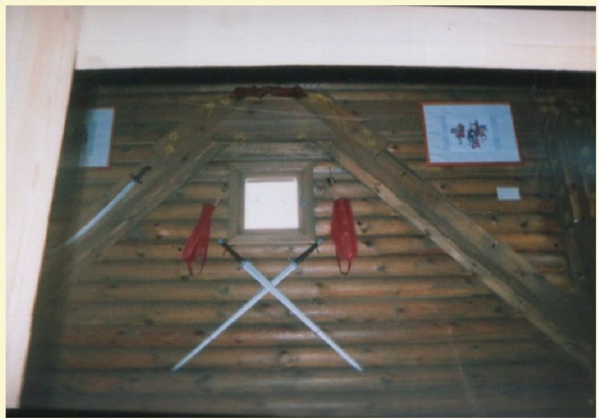
В оружейной башне