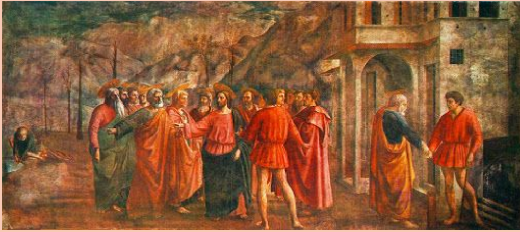
“Чудо со статиром”, Мазаччо

Возрождение - это не только художественный стиль, это огромный шаг вперед. В эпоху ренессанса изменилось то, как воспринимал окружающий мир человек и как видел себя в этом мире. Также изменилось отношение к Богу.