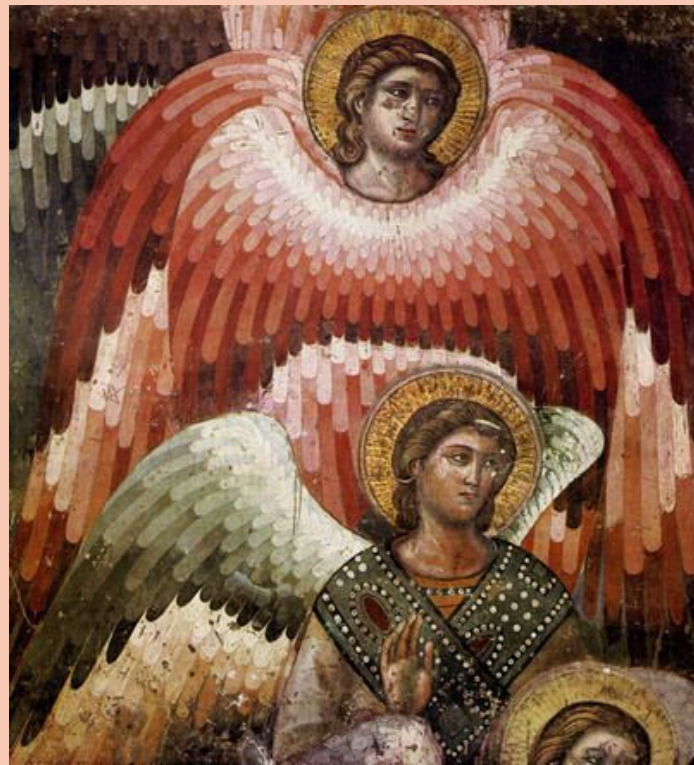
фрагменты, “Страшный суд” Пьетро Каваллини, 1300г

Эпоха Возрождения началась во Флоренции (Италия) в начале XV века, но его первые признаки появились в XIII век. Без Проторенессанса не было бы и Ренессанса.