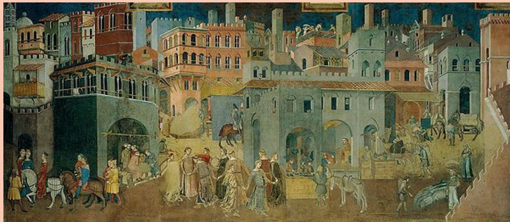
“Плоды доброго правления”, Амброджо Лоренцетти, 1339г

Характерно появление осязательности и материальной убедительности форм.