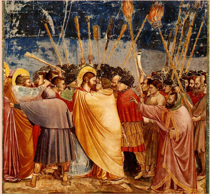
Джотто ди Бондоне, "Поцелуй Иуды", 1306 год

Ренессанс - эпоха в истории культуры Европы пришедшая на смену Средним векам и предшествующие Новому времени. Возникла в Италии в XIII-XIV вв.