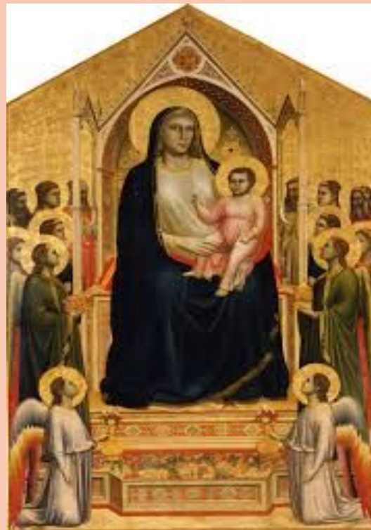
“Мадонна Оньисанти”, Джотто ди Бондон, 1310г