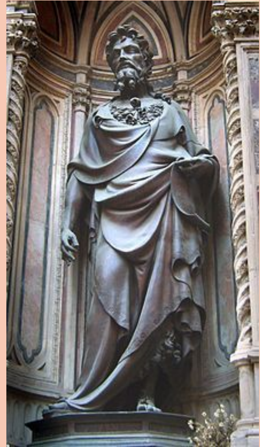
“Святой Иоанн Креститель”, Л. Гиберти

Возрождение - это не только художественный стиль, это огромный шаг вперед. В эпоху ренессанса изменилось то, как воспринимал окружающий мир человек и как видел себя в этом мире. Также изменилось отношение к Богу.