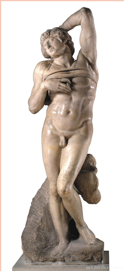
“Умирающий раб”, Микеланджело, Высокий Ренессанс

Наследие Древней Греции и Древнего Рима оказывало большое влияния на современников. Главной целью стало изучения античной культуры.