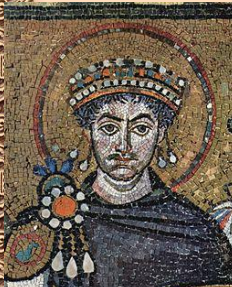
Юстиниан в старости.

Юстиниан получил власть в очень трудное время: от бывших владений осталась малая часть, в церкви начались разногласия, местная знать чинила произвол, крестьяне разбегались, в городах проходили бунты, наметился финансовый кризис.