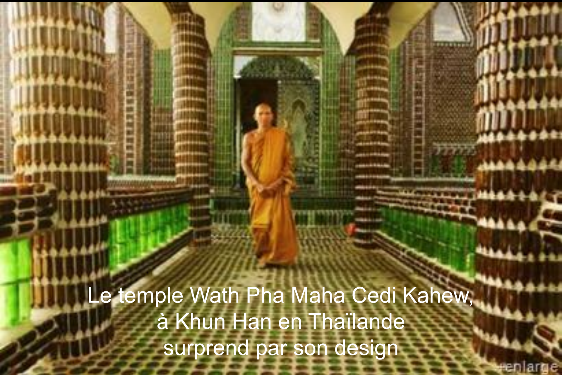
Le temple Wath Pha Maha Cedi Kahew, à Khun Han en Thaïlande surprend par son design