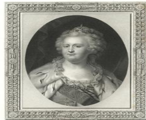
ЕЯ ВЕЛИЧЕСТВО ИМПЕРАТРИЦА ЕКАТЕРИНА II.