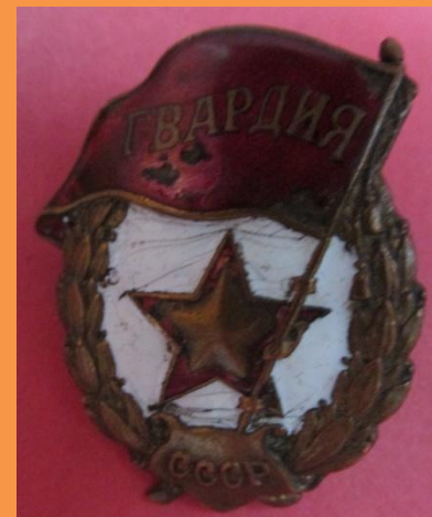
Орден «Гвардия СССР»