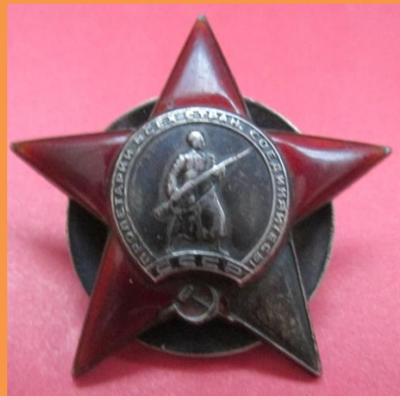
Орден Красной звезды