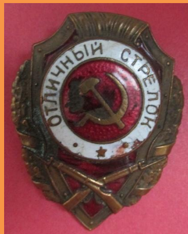
Знак «Отличный стрелок»