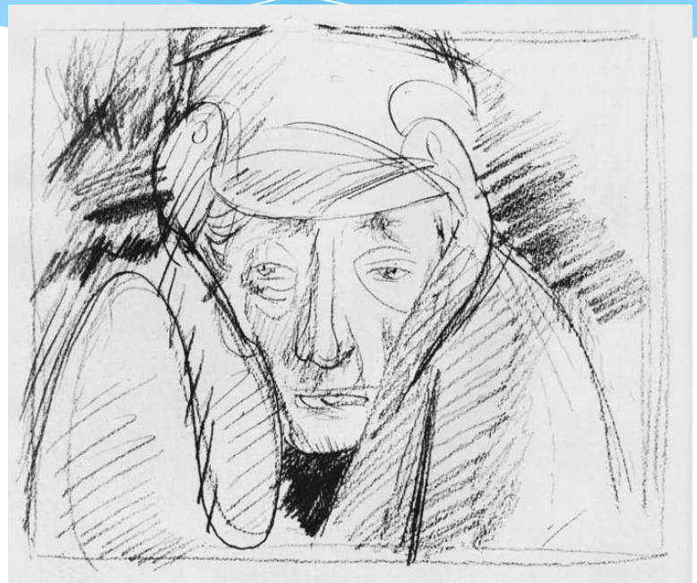
Рис .В.Н. Горяева