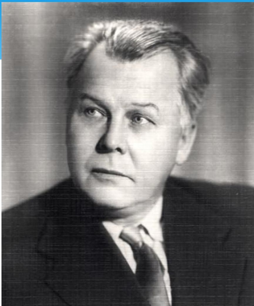
Александр Трифонович Твардовский, автор поэмы «Василий Теркин»