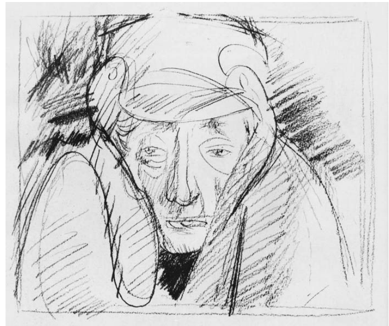
Рис .В.Н. Горяева

Лошадь, дунувшая в щеку Акакию Акакиевичу, производит «целый ветер». Эта деталь подчеркивает малость, незащищенность героя.