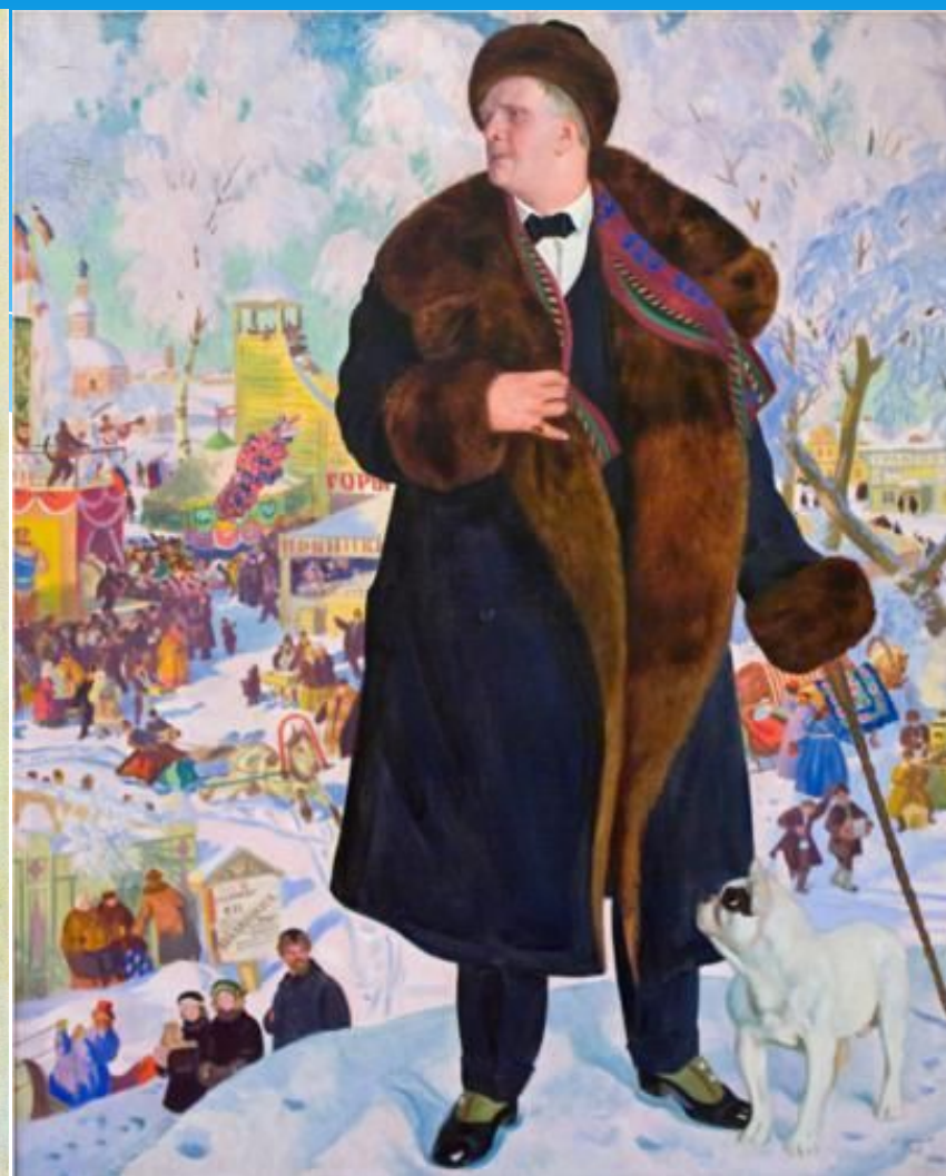
Б. Кустодиев. Портрет Ф.И. Шаляпина