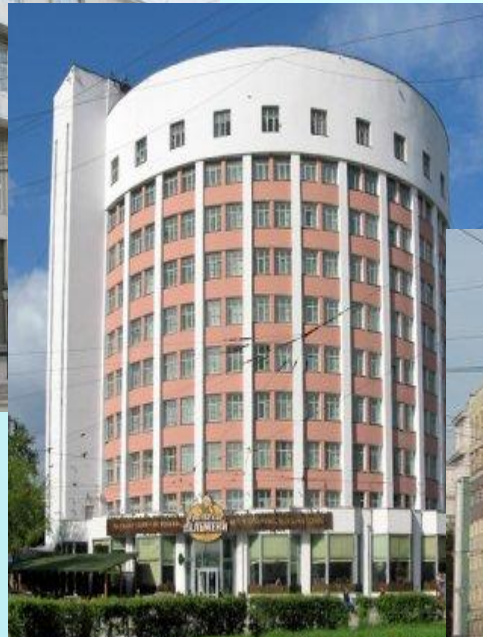
Гостиница Исеть в Екатеринбурге