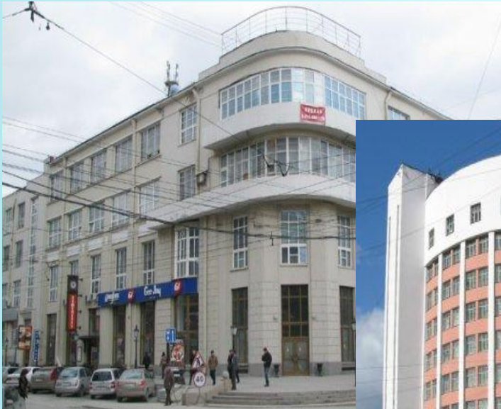
Здание Всесоюзного Текстильсиндиката (Дома Текстилей) в Новосибирске.