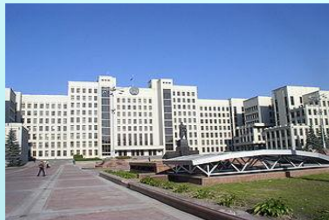
Дом правительства Республики Беларусь, построенный с 1930 по 1934 г.г.