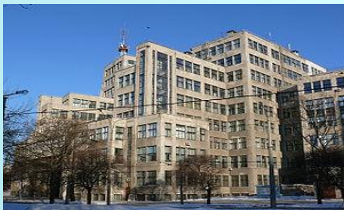
Жилой дом в Харькове дом «Слово», построенный в конце 1920 –х годов