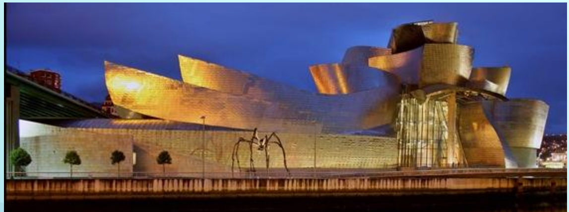
Музей Guggenheim (Бильбао, Испания)