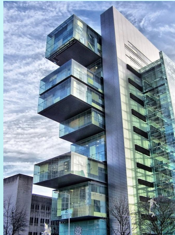
Манчестерский центр гражданского правосудия. Манчестер, Великобритания.