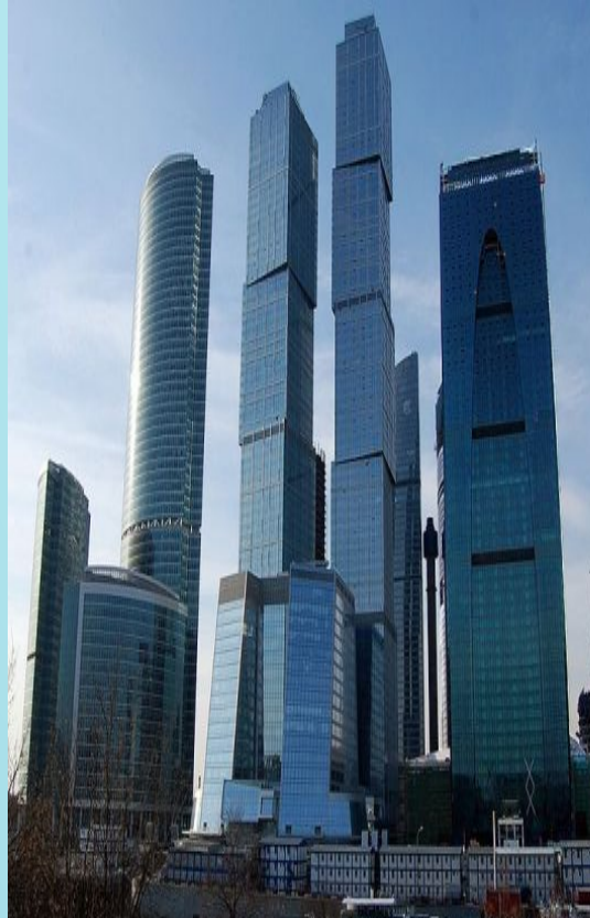
Москва-Сити, Москва, Россия