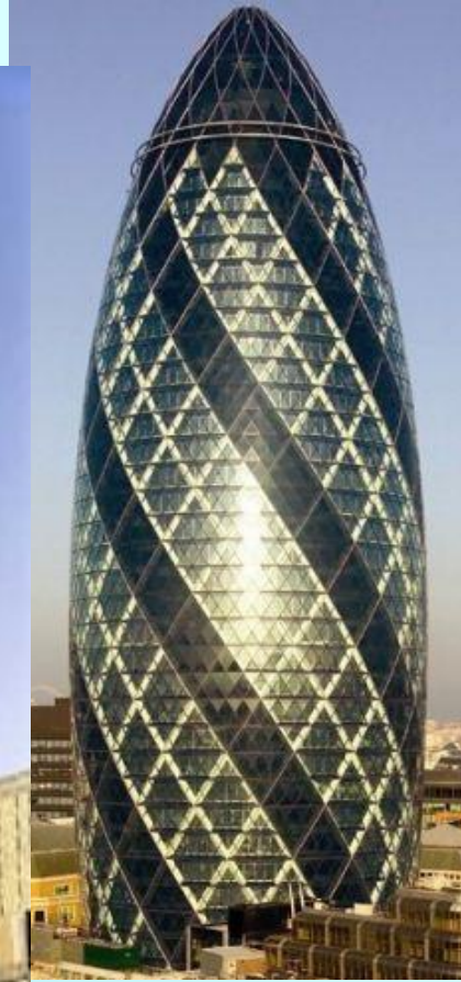
Главный офис страховой компании «Swiss Re», Лондон, Великобритания