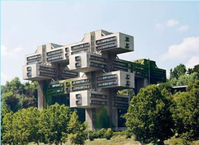
Министерство автомобильных дорог. Тбилиси, Грузия

В XX веке на смену принципам симметрии в архитектуре пришли принципы асимметрии и динамического равновесия