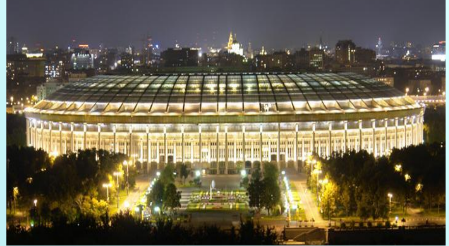
Стадион «Лужники» . Москва