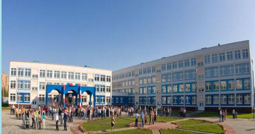
Школа. Одинцовский район.

«Форма следует функции» (Луи Генри Салливен)