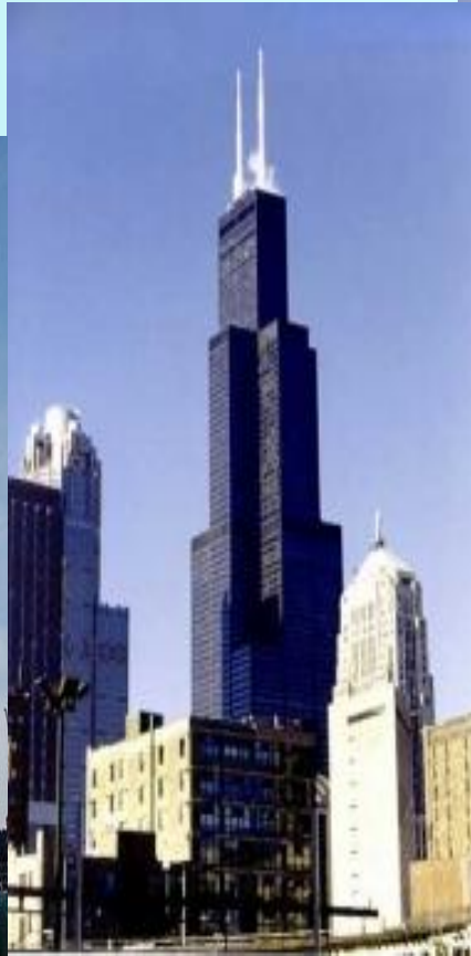
Сирс Тауэр, Чикаго, США.