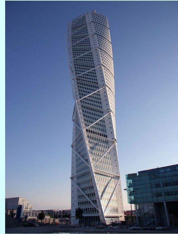
Кручёная башня. Мальме, Швеция.