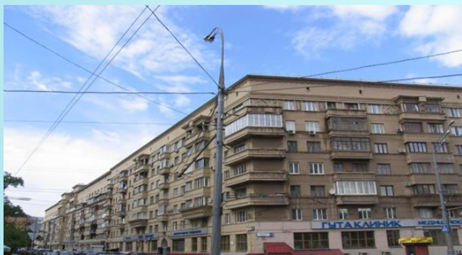
Москва, Оружейный переулок дом 27, построенный в 1920-е годы