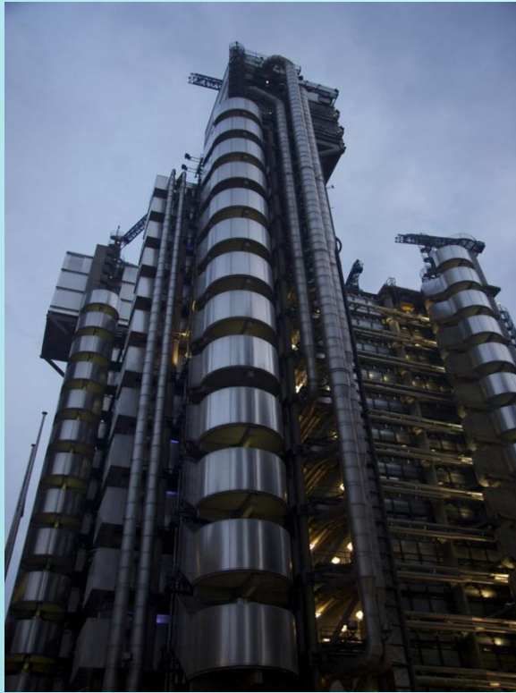
Офис корпорации Лоид Лондон, Великобритания.