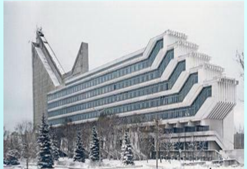
Корпус факультета архитектуры политехнического университета. Минск, Беларусь.