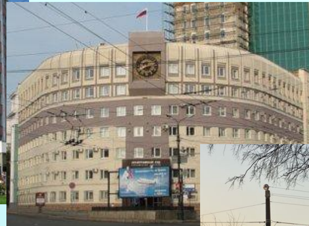
Здание арбитражного суда Челябинской области