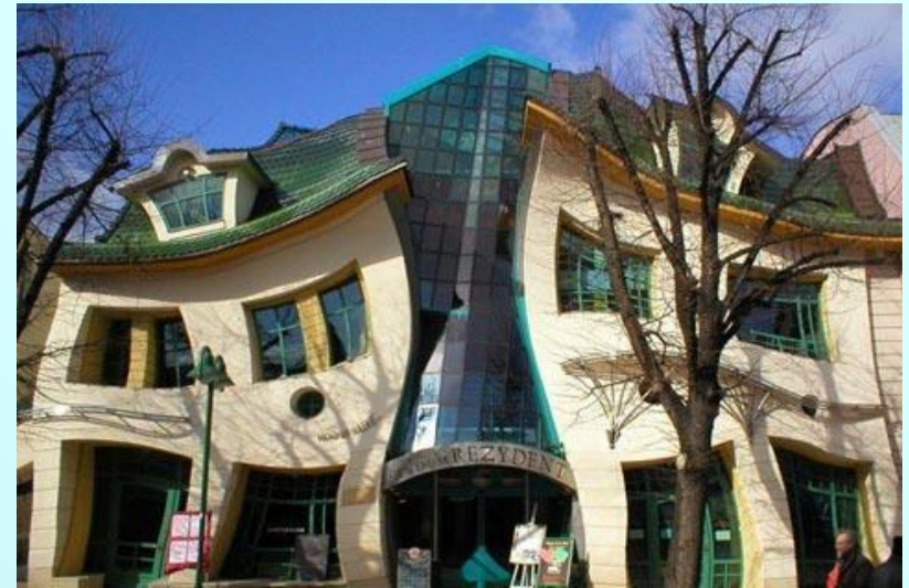
Изогнутый дом (Сопот, Польша)