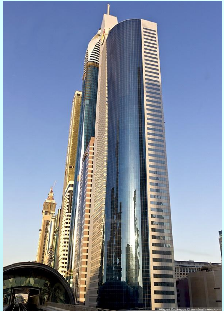
Дубай - небоскрёбы на шоссе шейха Зайда

Архитектура современности — ЭТО ВО МНОГОМ отрицание канонов прошлого. Невозможно «одеть» современные здания, предназначенные для новых целей, в архитектурные формы прошлого.