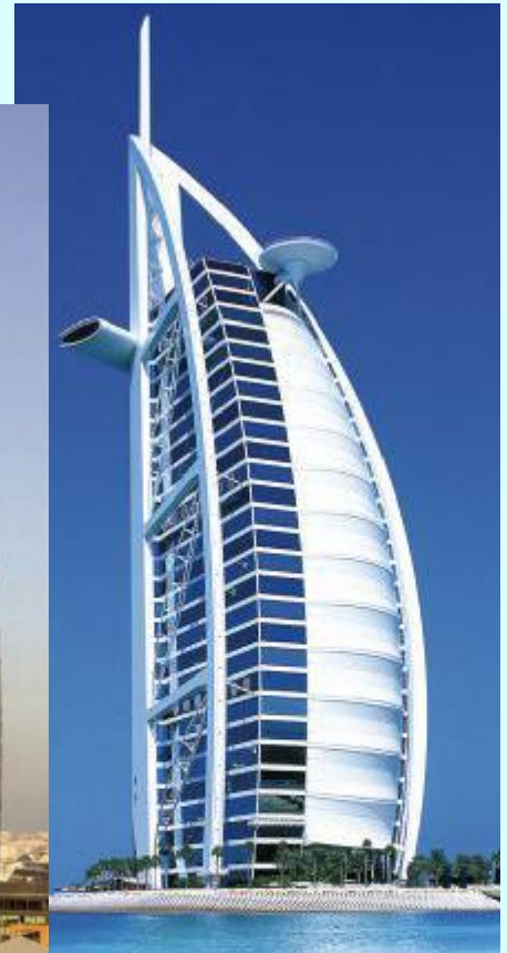
Burj Al Arab (отель Парус) Дубай, ОАЭ