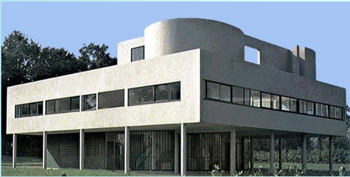
Вилла Савой. Франция, Пуаси (модернизм)

Современные архитекторы используют самые различные стили : постмодернизм, модернизм, конструктивизм, хай-тек и т.д. Кроме того, эти стили комбинируют, иногда весьма смелым образом