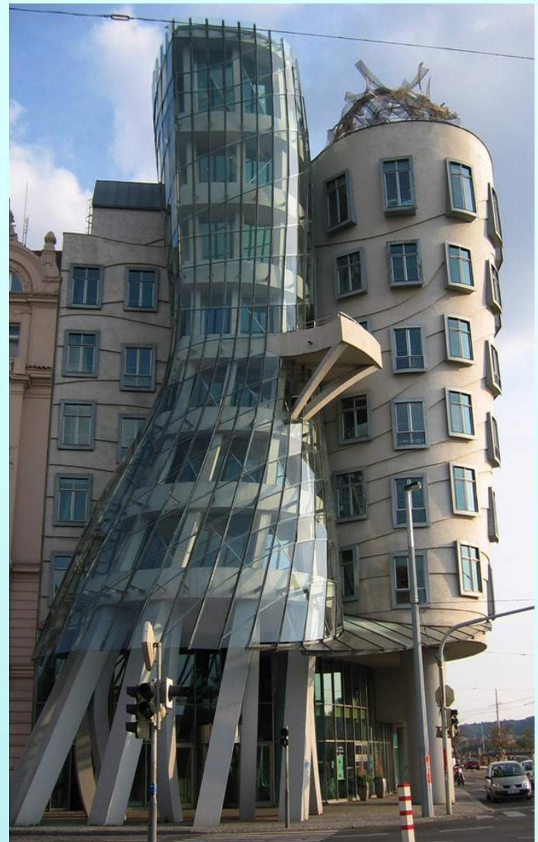
«Танцующий дом», здание Национале Нидерланден в Праге

Для возведения форм используют новейшие достижения в компьютерной и строительной технологии.