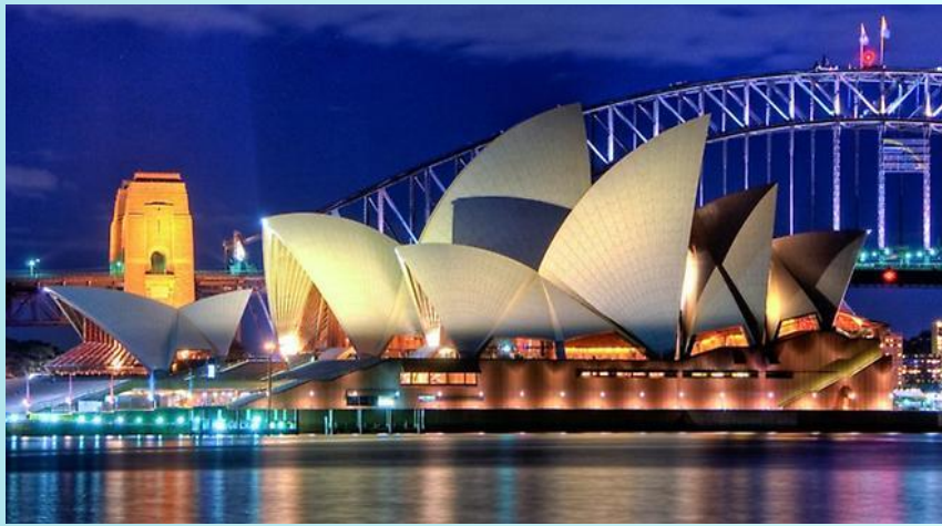
Оперный театр. Сидней

«Форма следует функции» (Луи Генри Салливен)