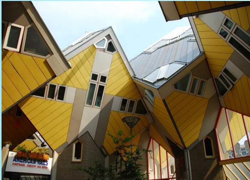
Кубические Здания (Роттердам, Нидерланды)

Архитектура нашего времени свободна в выборе идей и форм, она не подчиняется какому-либо определенному стилю. Все стили являются равноправными.