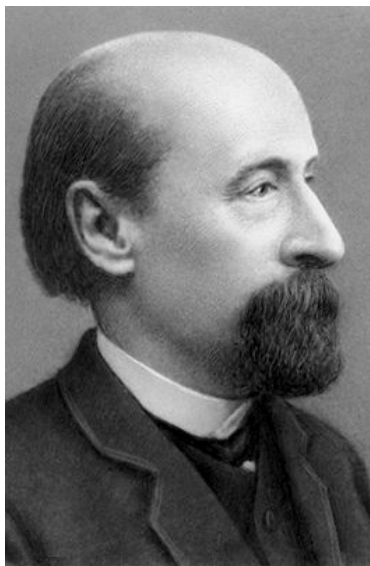
И.М. Балинский (1824 – 1902)

Организовал первую в России кафедру психиатрии, первую клинику душевных болезней, первую школу русских психиатров. Балинский стремился доказать необходимость тесной связи психиатрии с общесоматическими клиническими дисциплинами, с физиологией.