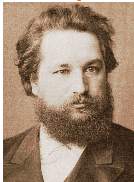
С.С. Корсаков (1854—1900)

Организовал первую в России кафедру психиатрии, первую клинику душевных болезней, первую школу русских психиатров. Балинский стремился доказать необходимость тесной связи психиатрии с общесоматическими клиническими дисциплинами, с физиологией.