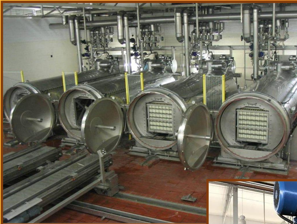
БЛАНШИРОВКА / ОБЖАРОЧНАЯ ПЕЧЬ