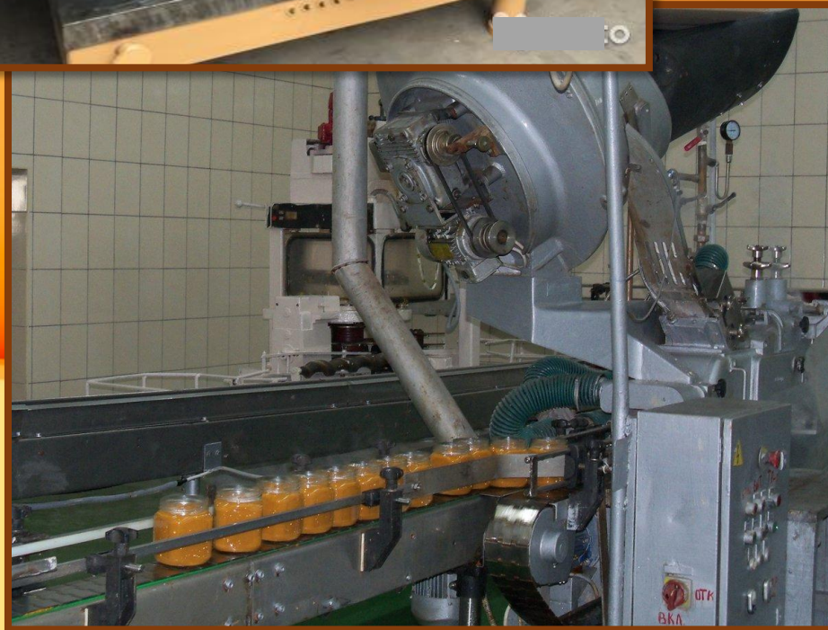
ЛИНИЯ ФАСОВКИ ИКРЫ