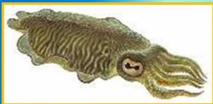
Каракатица обыкновенная сепия

Из современных головоногих наружная раковина есть лишь у наutilusов. У кальмаров от раковины осталась только узкая пластинка, у каракатиц чаще всего есть внутренняя раковина, у многих осьминогов раковина совсем исчезла.