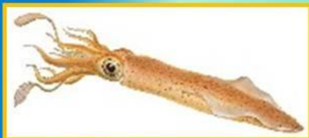
Кальмар европейский лолиго