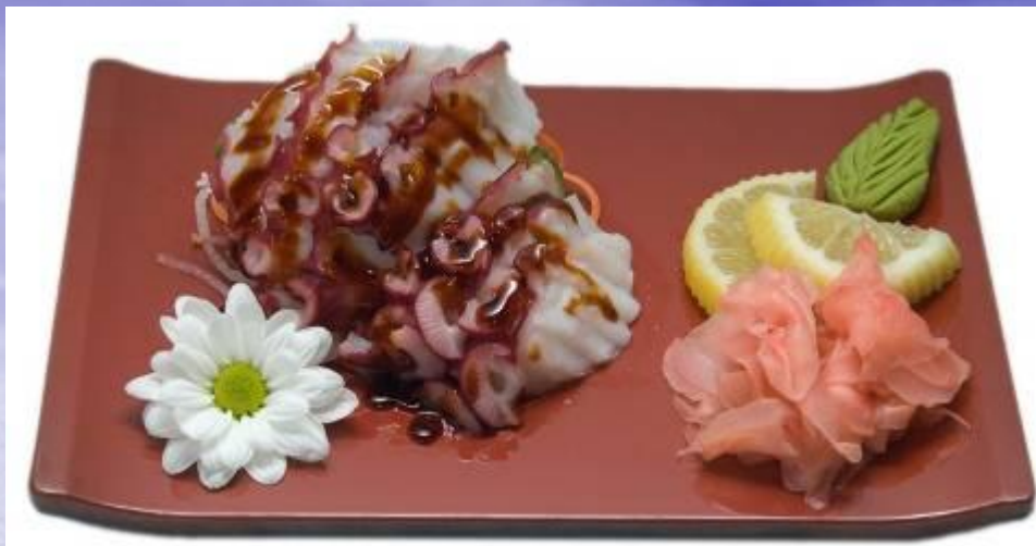
Осьминог и кальмар на ужин