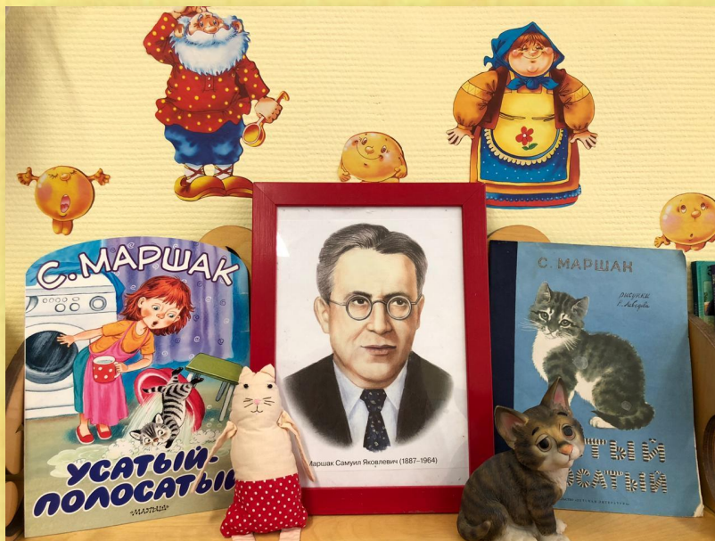
Портрет писателя и разные издания книги (2017 и 1968 года)