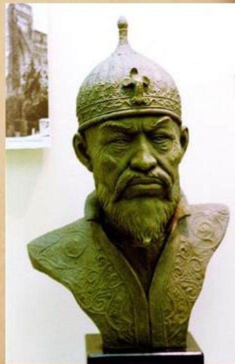
Герасимов Михаил Михайлович, советский ученый