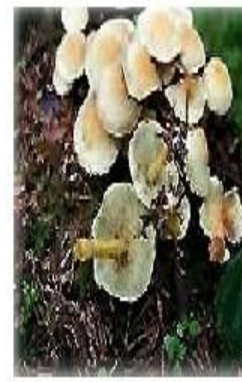
Опенок ложный серно-желтый