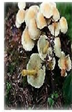
Опенок ложный серно-желтый