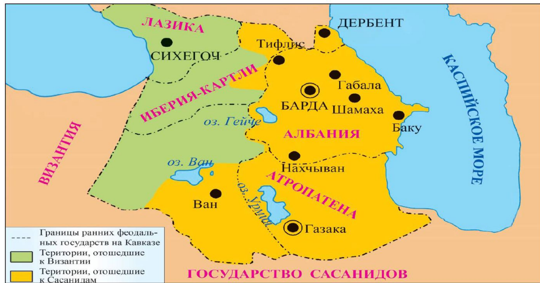
Кавказ (IV–VII века)