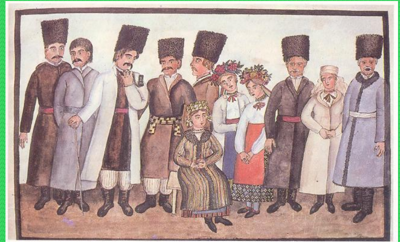
Sayans des villages: Glevakha, Kojoukovska, Bougaevka, Lmitovka, Zhimer, Kipolit, Vitatshew, Loukovska, et Bielohotodka, district de Kiev. Крестьяне селеніяхъ Левакскаго, Кожувскаго, Бугаевскаго, Дмитровскаго, Зымерскаго, Трипольскаго, Витавескаго, Жуковскаго, Блатородскаго, кievс. уездѣ.

● За своїм правовим становищем воно поділялося на «непохожих» (або «отчичів») і «похожих» (або «вільних») селян. Правом безперешкодного переходу від одного землевласника до іншого користувалися лише останні.