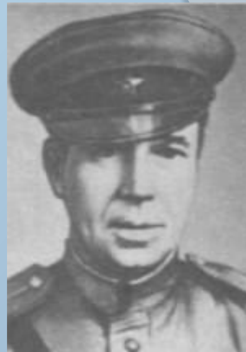
Удзельнік вызвалення г. Барысаў