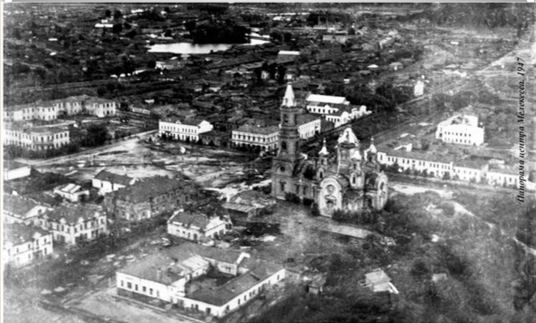
Панорама центра Мелитополя. 1947