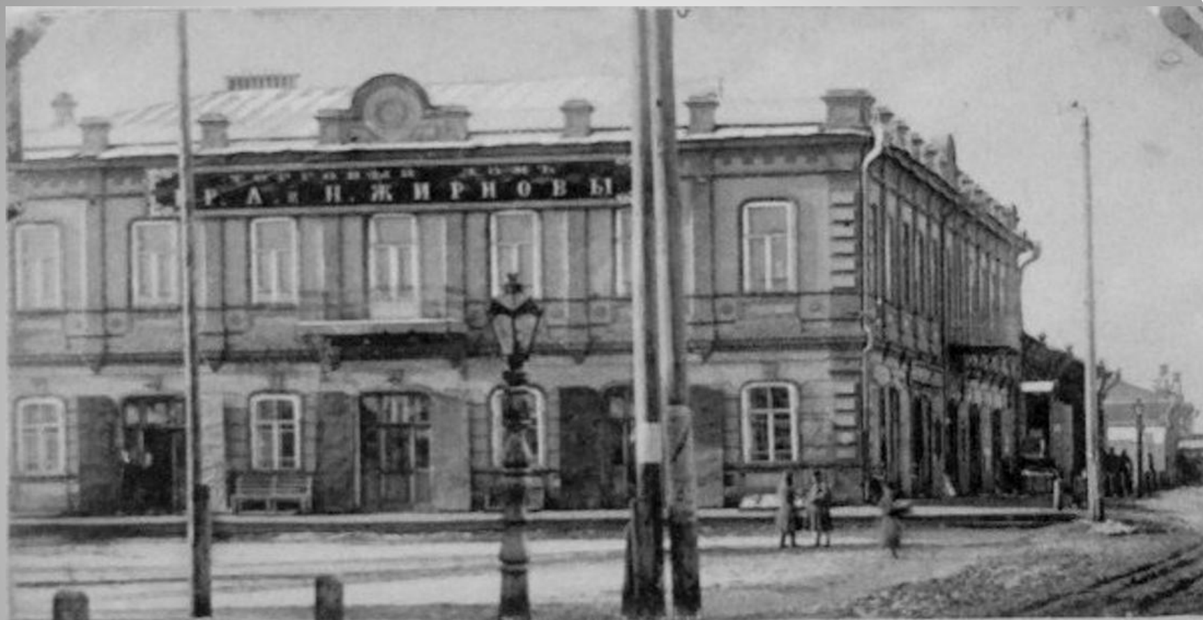
7. Пос. МЕЛЕКЕССЪ, Сам. губ.