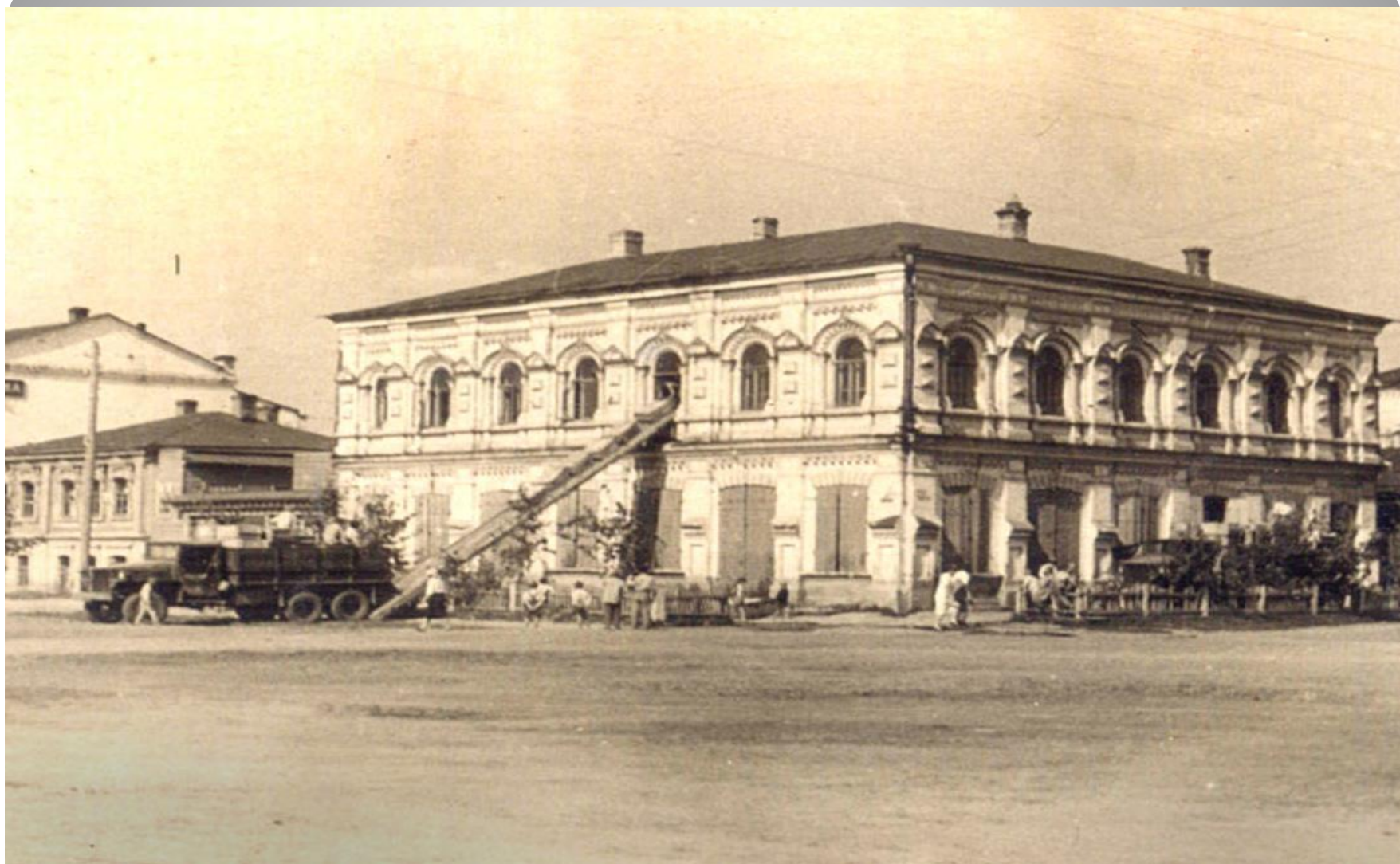
Пятый этап. В годы войны здание банка так выглядело.