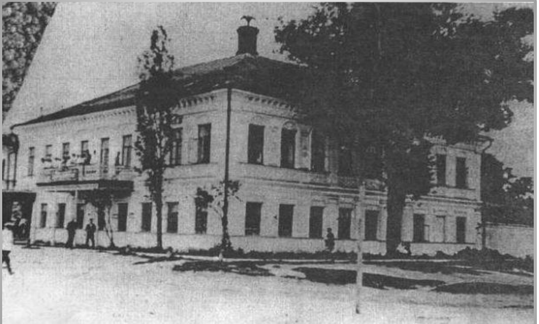
Седьмой этап. «Дом Соловьёва». Отвечаем на вопросы о предприятиях, эвакуированных в Мелекесс.