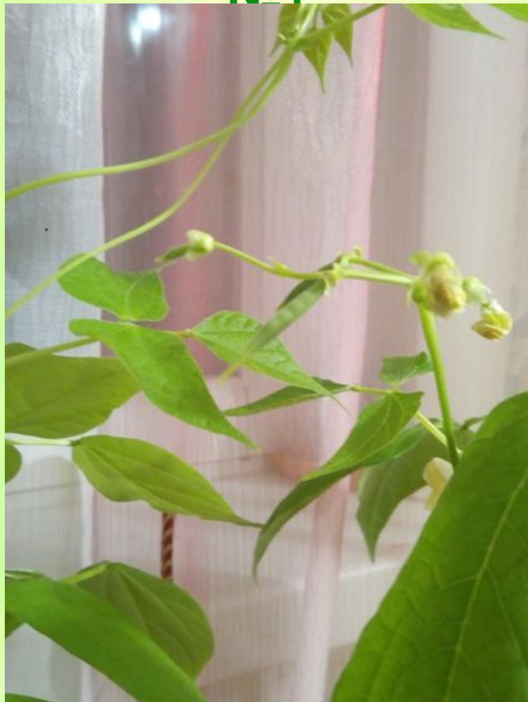
34 день Появились стручки у №1