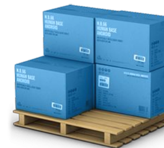
5. Товары в обороте (не более 30% от суммы займа)

Возможность привлечения залога третьих лиц