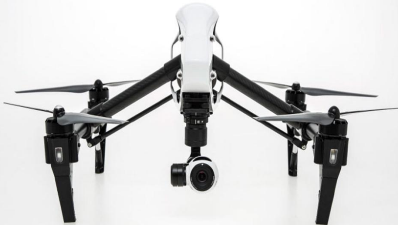
DJI inspire 1