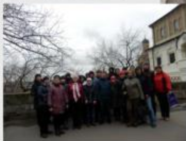
Музей - Английские подвалы Музей - Дети Москвы Экскурсия на Красную площадь Познавательная экскурсия по району