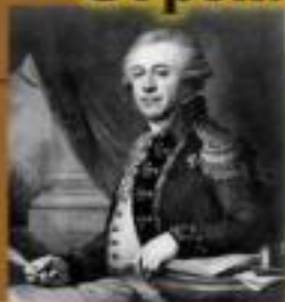
Иван Лазаревич Лазарев (1735-1801)