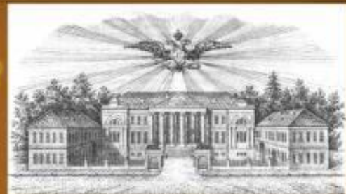
Армянских господ Лазаревых гимназия. Сверху герб рода