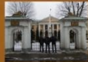
У ворот Армянского посольства