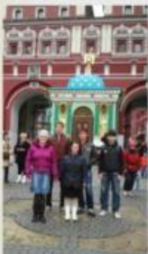
Экскурсия по изучению архитектуры древнерусского зодчества