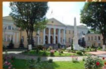
С 1827 по 1921 год – Лазаревский институт восточных языков