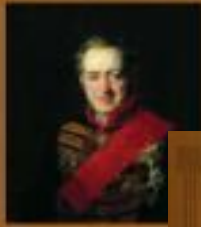
Иван Екимович Лазарев (1786-