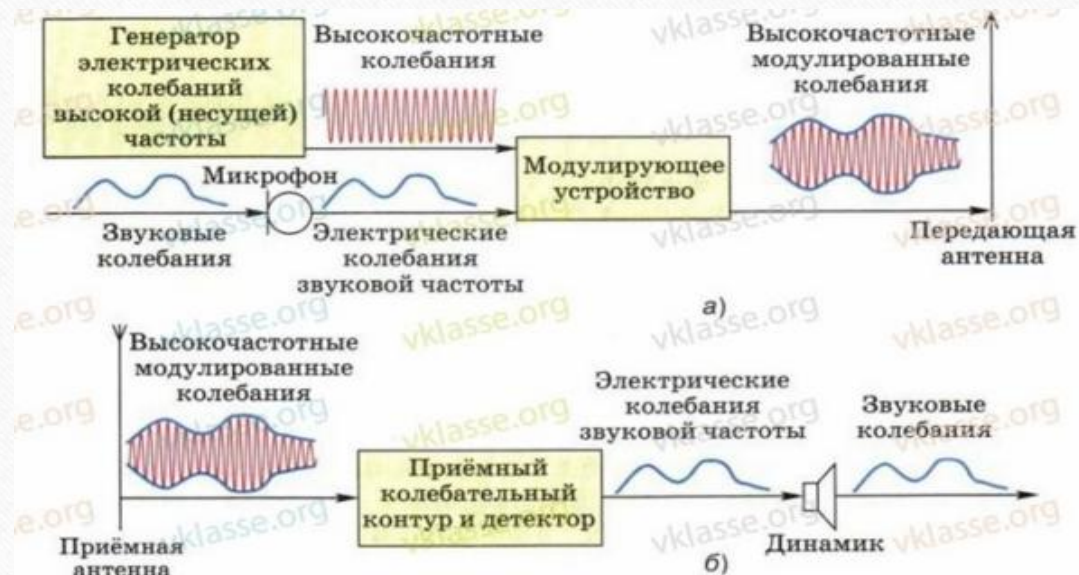
Схема процесса радиосвязи.