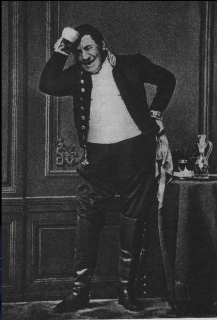
И. И. Сосницкий в роли городничего. Фотография. 1860-е годы.