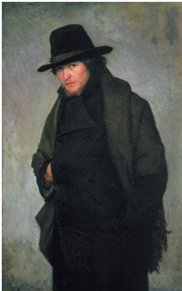
Николай Ярошенко - Студент (1881)