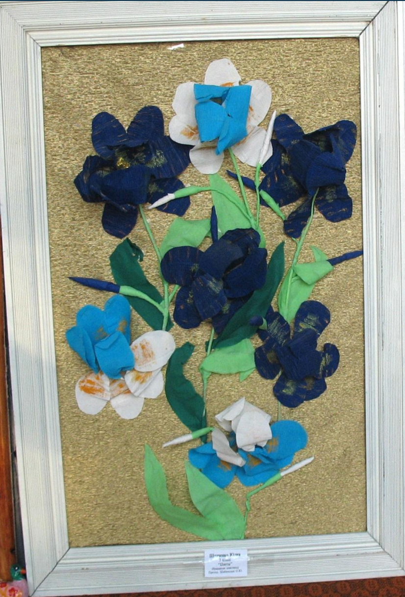
Шаранга Өлкө "Түгөт" Мирисан Аян Кыргыз Республикасы