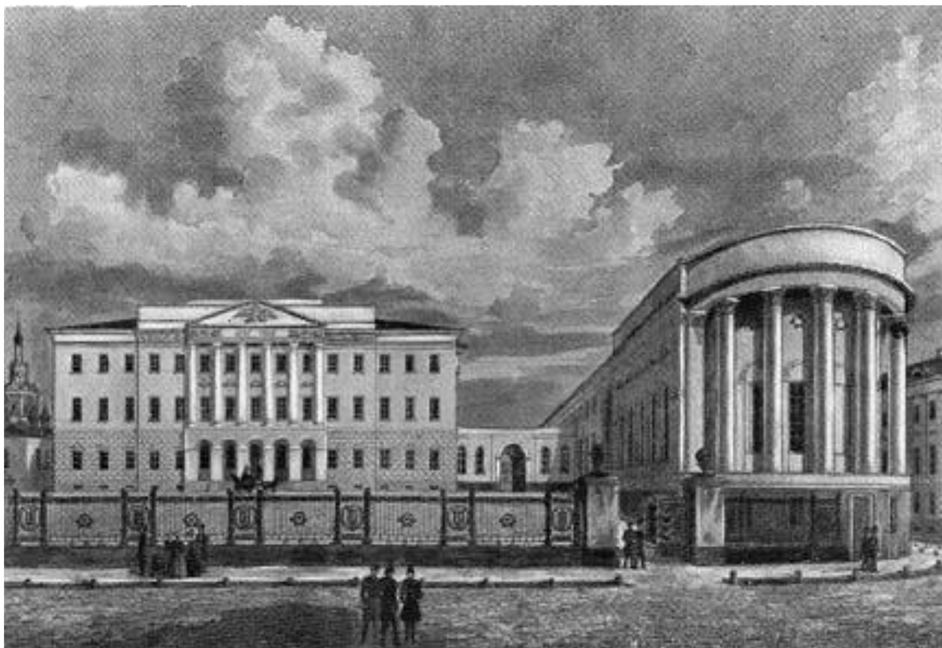
пансион Крюммера в городе Верро