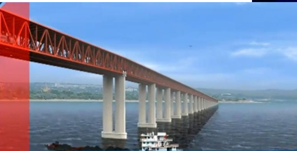
Мост через Керченский пролив