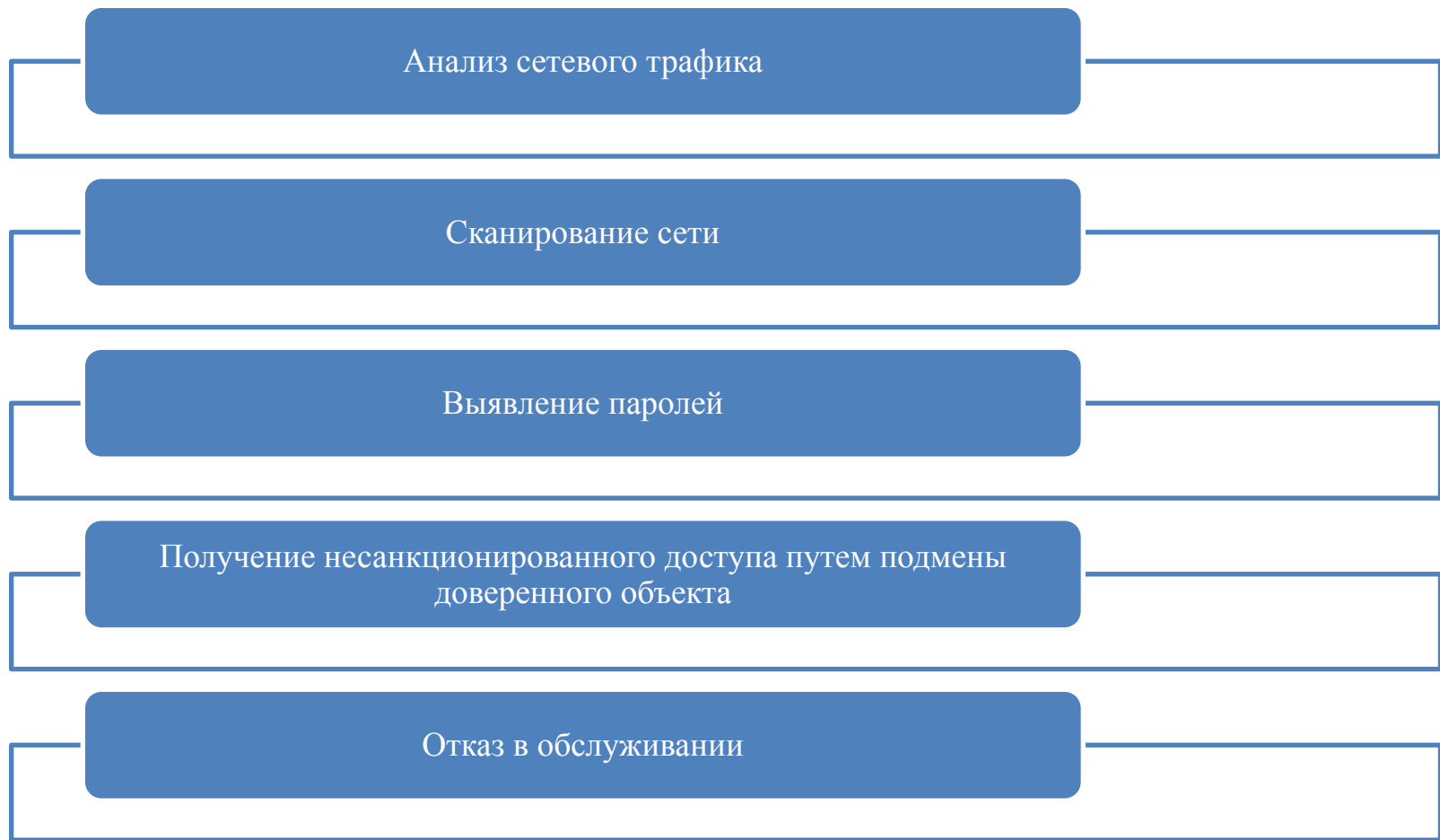
Рисунок 5 – Уязвимости, с помощью которых могут быть реализованы угрозы несанкционированного доступа по каналам связи