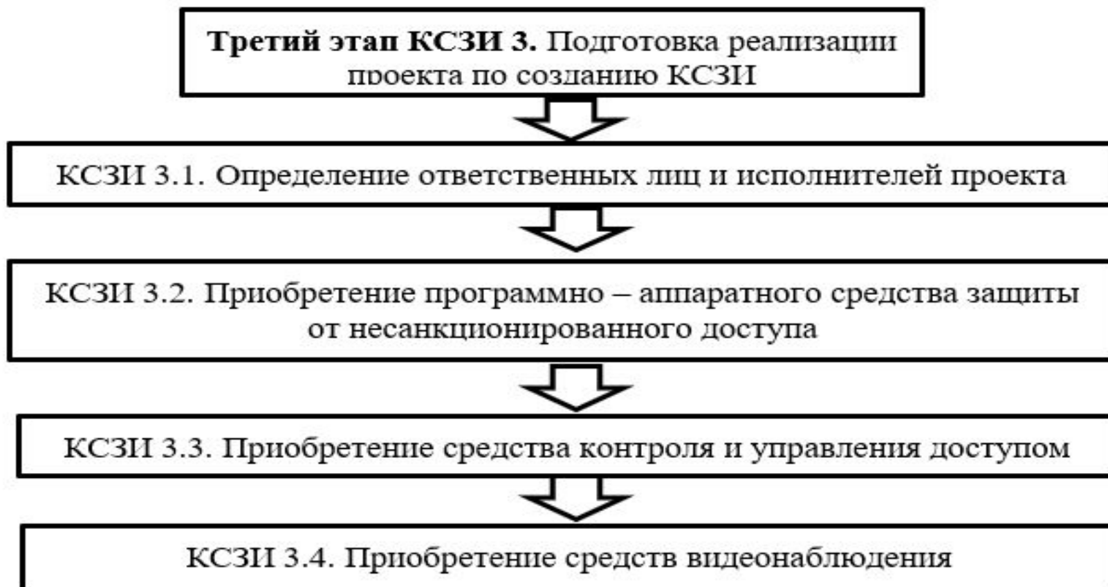
Рисунок 8 – Виды работ на третьем этапе КСЗИ 3. Подготовка к реализации проекта по созданию КСЗИ в ООО «АНТ-Консалт»