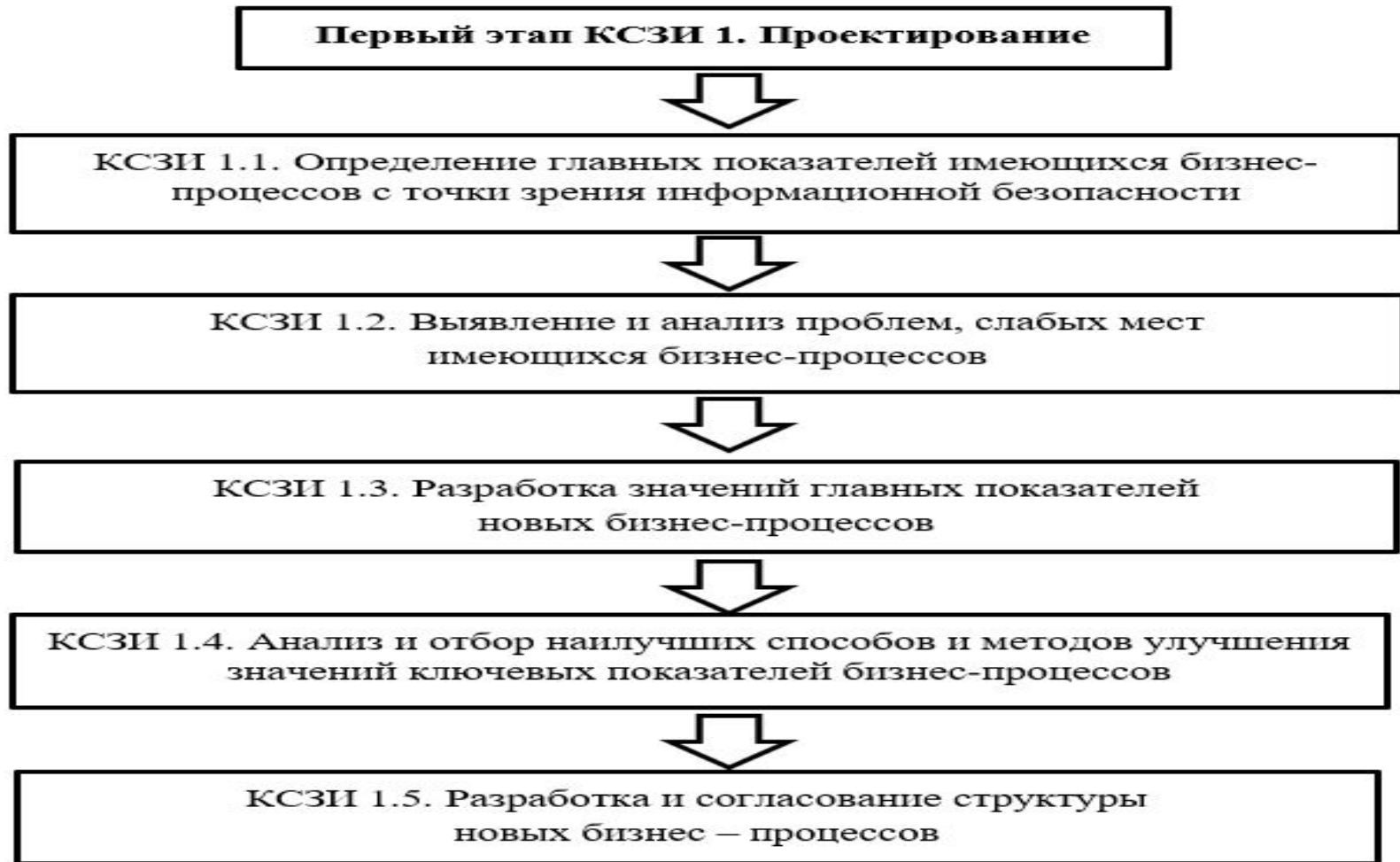
Рисунок 6 – Виды работ на первом этапе КСЗИ 1. Проектирование в ООО «АНТ-Консалт»