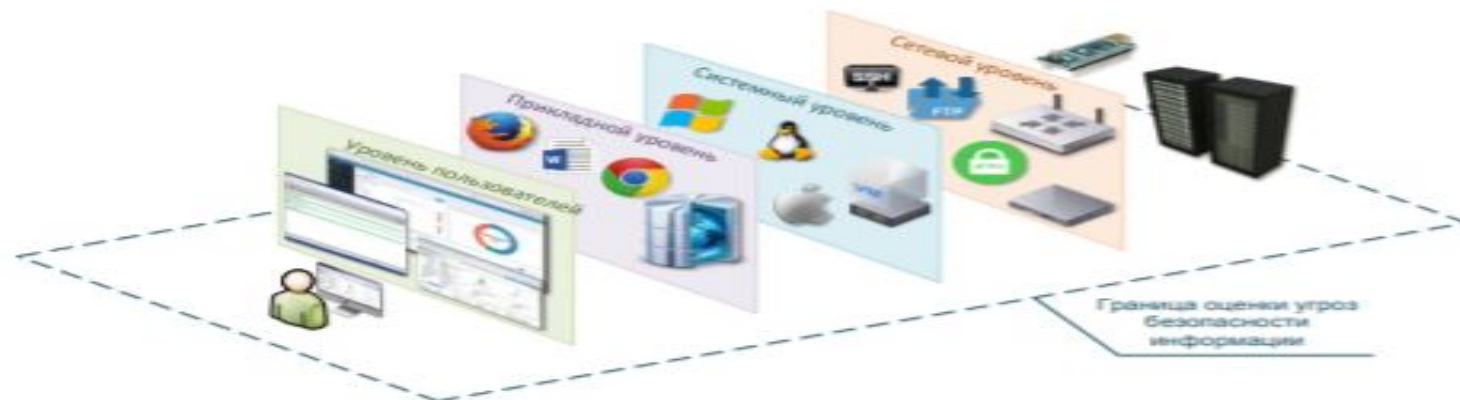
Рисунок 3 – Уровни архитектуры систем и сетей, на которых определяются объекты воздействия угроз и уязвимостей в ООО «АНТ-Консалт»