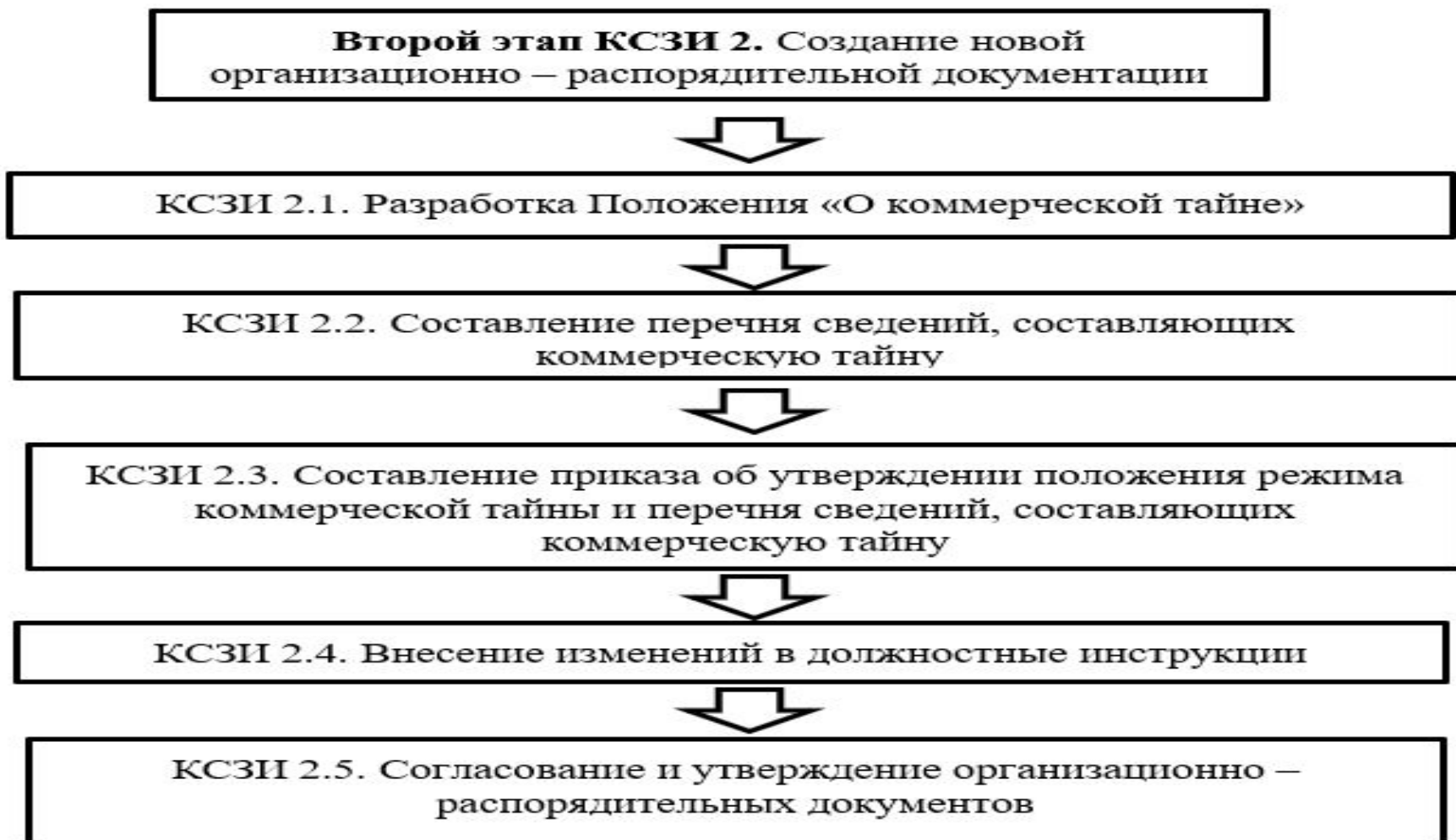
Рисунок 7 – Виды работ на втором этапе КСЗИ 2. Создание новой организационно – распорядительной документации в ООО «АНТ-Консалт»