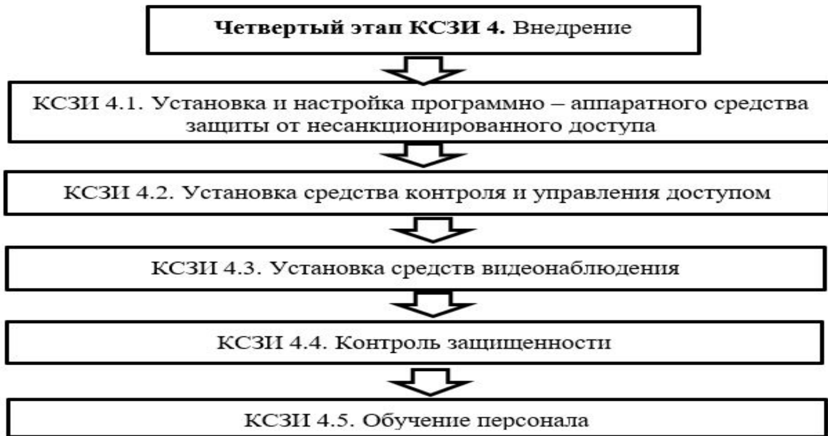
Рисунок 9 – Виды работ на четвертом этапе КСЗИ 4. Внедрение в ООО «АНТ-Консалт»